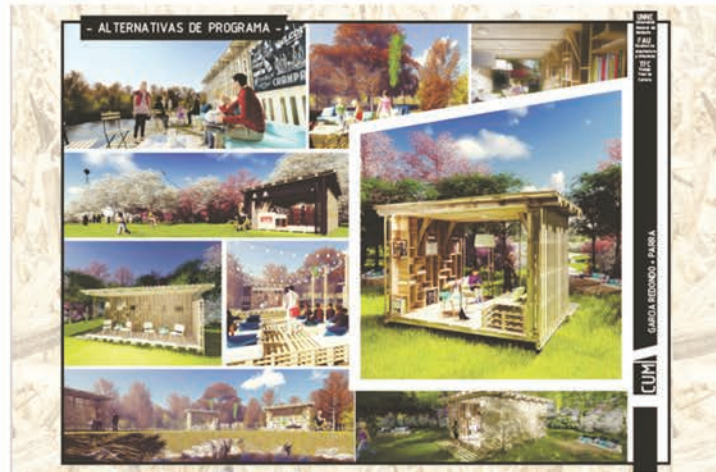
Fig. 2. Imágenes soporte de clases especiales dictadas en la asignatura

de "lo anterior", y pueden evidenciar su avance en el proceso.