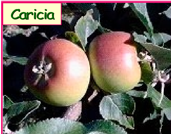
Foto 1: Cultivares “Caricia”, “Anna” y “Eva” de bajos requerimientos de horas de frío que se cultivan en San Luis del Palmar – Corrientes – Argentina.

se concluye que en la zona el cultivar Anna es el que se comporta como más temprano comparado con Eva (intermedia) y Caricia de cosecha más tardía.