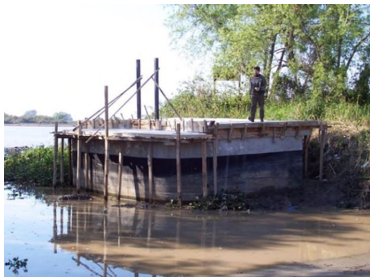
Figura N° 1.

El proyecto es aprobado y comienza la construcción del prototipo que vemos en las imágenes, el cual es finalizado en año 2007.