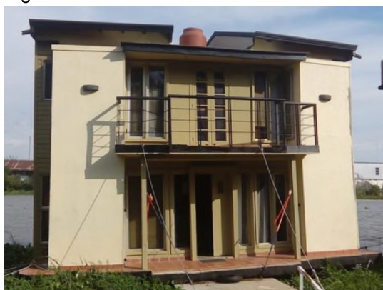
Figura N° 3.