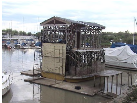
Figura N° 2.