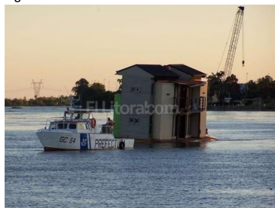
Figura N° 4.

Figura N° 1. Base flotante hueca de Hormigón Armado 90M 3 de desplazamiento. Proyecto ANR043/03 SeCyT BID.