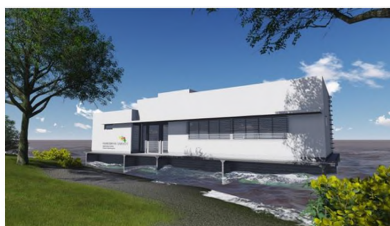
Figura Nº 6

Figura Nº 5. Axonometría del Centro de Salud.