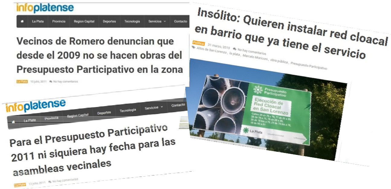
Fig. 1: Información periodística.

presupuesto participativo pudo generar conflictos en relación al modo en que la intersectorialidad es incorporada en la ejecución del instrumento, ya que generar una nueva dependencia puede favorecer la desarticulación y perder la integralidad de los problemas, además de incorporar nuevos actores e instituciones quizás innecesarias. Repetto (2008) menciona que el exceso de subdividir organismos en diferentes áreas puede conllevar a generar tensiones en las relaciones de poder de quienes están a cargo, provocando la ineficacia e ineficiencia del sistema. Estas cuestiones pueden reflejarse en la opinión de algunos vecinos en relación a lo producido con los recursos de esta herramienta.