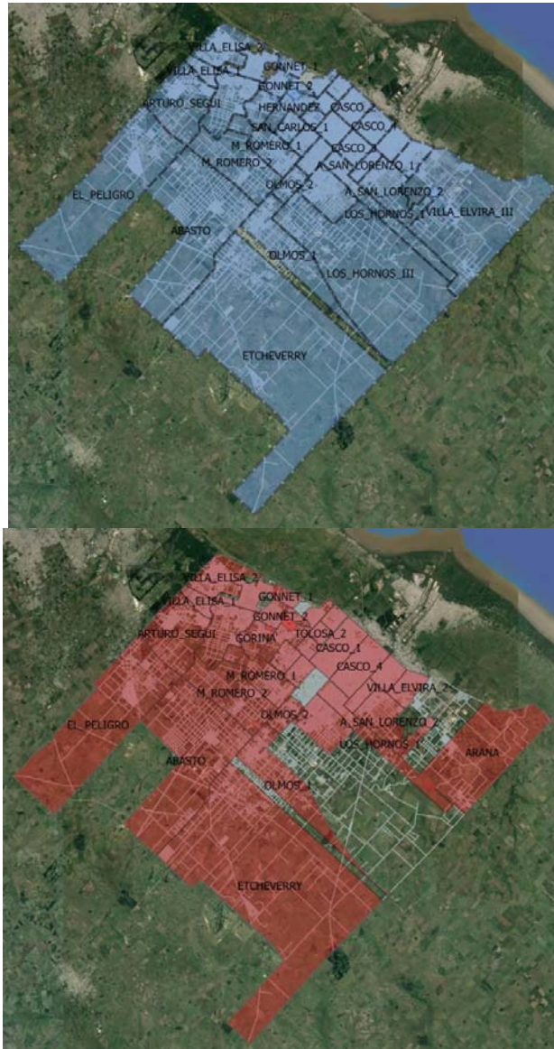
Fig.2: Organización territorial del PP año 2008 y 2015 en La Plata. Imagen satelital de Google Earth + Elaboración propia de mapeo en GIS de la zonificación.

Para el año 2015 se llega a una organización en 30 regiones presupuestarias en total: las regiones del casco se unifican en Casco 1 y Casco 2, y desaparecen las correspondientes a Los Hornos III, San Carlos III, Altos de San Lorenzo III, Tolosa III y Villa Elvira III, sin especificarse en ningún documento si fueron absorbidas por otras regiones presupuestarias. Por otro lado, se crea la delegación Arana en parte de lo que fue la Subdelegación Villa Elvira III.