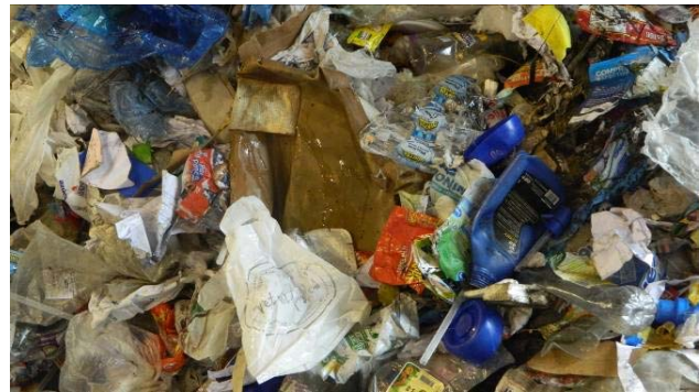
Fig. 2: Prolim, detalle de la fracción plástico film

Actualmente son enterrados prácticamente sin tratamiento ni protección del suelo. Se trata de materiales con un flujo de generación que se prevé constante y que presenta dos problemas: no se reaprovecha y contamina el medio. La situación de Trenque Lauquen se repite en otros municipios de la zona (9 de Julio, Bolívar, etc.) así como en el resto del país.