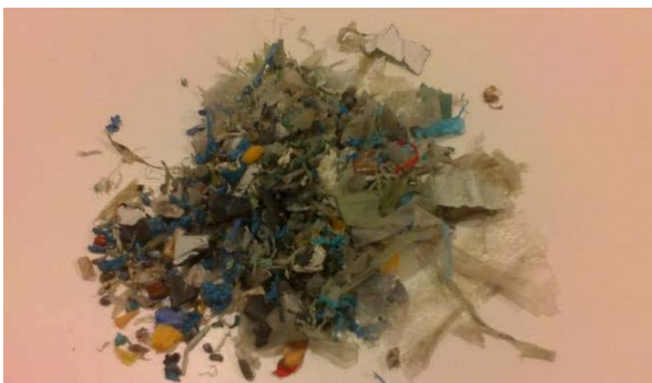
Fig. 3: Triturado de restos de polietileno

El polietileno de baja densidad, aun conteniendo residuos orgánicos y restos de otros plásticos, puede reciclarse en un material de menor calidad técnica, un tipo de plástico heterogéneo y de bajas prestaciones respecto de la materia que le da origen, aplicables a usos que no supongan elevadas calidades sanitarias, mecánicas, térmicas, etc. (figs. 3 y 4).