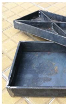
Figs. 8 y 9: Termoprensa y molde fabricados en la FRTL UTN