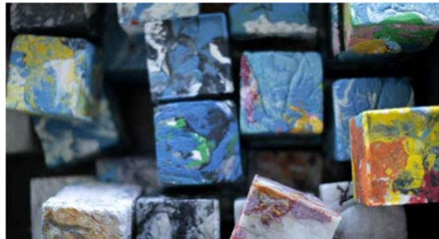
Fig 7: Plástico reciclado prensado

El material plástico reciclado (pellets, scraps, o aglomerado) puede ser procesado directamente, obteniéndose productos con menores especificaciones que las fabricadas con plástico virgen. Con la formulación adecuada, puede procesarse junto con resina virgen; esto permite una disminución en los costos de producción. Existen varias técnicas para conformar los polímeros. El termoplástico es calentado a una temperatura cercana o superior a la temperatura de fusión, de tal manera que se haga plástico o líquido. Entonces es vaciado o inyectado en un molde, produciendo la forma deseada.