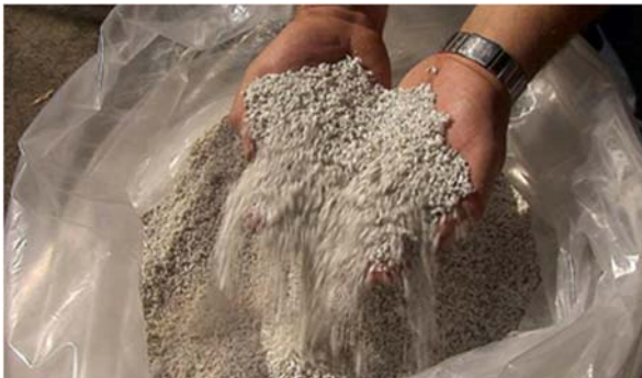
Fig. 6: Plástico reciclado aglomerado (imagen Interempresas)

En el caso de MAPER, donde el material a reciclar proviene principalmente de bolsas de PEAD, se debe incorporar al proceso de reciclado mecánico una etapa de aglomeración (fig. 6). Mediante este proceso se incrementa la densidad del material a reciclar. La materia prima es introducida en la máquina aglutinadora, la cual es de forma cilíndrica, tiene cuchillas fijas en los lados y giratorias en el centro. El calor generado por la fricción de estas cuchillas eleva la temperatura del proceso y determina el incremento de la densidad del material por el encogimiento y plastificación parcial. Así, la temperatura a la que llega el proceso es a la de semiplastificación (70 - 90 °C). El material es enfriado generalmente con agua, solidificándose y tomando formas irregulares. El producto final es conocido como aglomerado, que puede pasar a una etapa de pelletizado o directamente a una de moldeo.