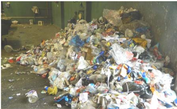
Fig. 1: Prolim, separación de la fracción plástico film

venta. Otro tanto ocurre con los residuos orgánicos, reconvertidos en tierras de abono. Todo ello se realiza en instalaciones municipales y con personal propio. Una de las fracciones que, si bien se consigue separar, no ha sido posible reutilizar hasta ahora es el polietileno de baja densidad (PEBD) y otros plásticos, proveniente mayormente de bolsas y films de embalajes. Estos residuos (Figs. 1 y 2), mezclados con restos orgánicos, presentan un elevado volumen y durante un tiempo se acopiaban, por lo que existe un cierto stock.