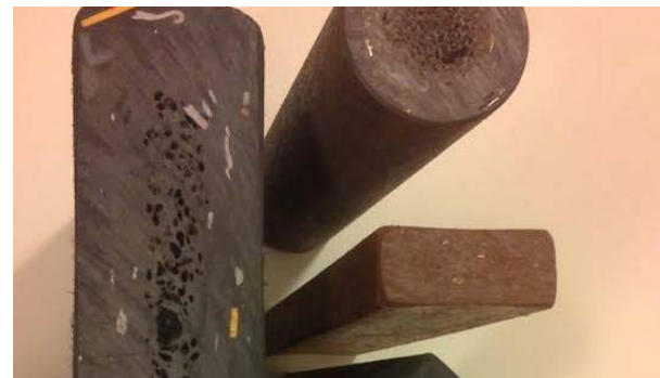
Fig. 4: Perfiles de polietileno reciclado

Este plástico reciclado se obtiene a partir de la fracción de los residuos sólidos urbanos conformada por bolsas y films, que, una vez separados de otros materiales y lavados, son fundidas para obtener un primer compuesto de plásticos varios aglomerados que, posteriormente, dará lugar a una nueva fusión de perfiles o listones aplicables, por ejemplo, a pavimentos y mobiliario urbano no sometidos a exigencias técnicas importantes. Dada esta experiencia, se aprovecha el conocimiento y tecnología existentes, tanto a nivel nacional como internacional, para