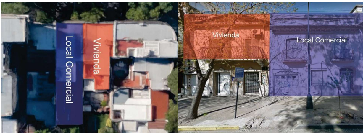
Figuras 1 y 2: Ubicación de la vivienda afectada en relación a la fuente de ruido.

La vivienda afectada se desarrolla en planta alta, con un dormitorio y estar-comedor al frente, en el contrafrente, se encuentra el dormitorio principal, la cocina, el lavadero y una terraza abierta.