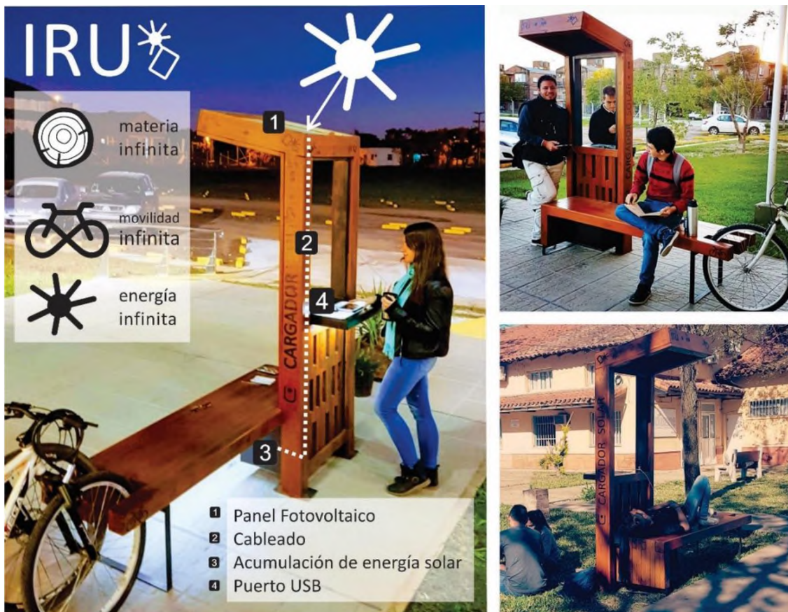
Figura 6: Fotografías del Cargador Solar en Madera. Ejemplo de equipamiento urbano sustentable.

El desarrollo se enmarca en el Proyecto de investigación “Construcción sustentable, desde la perspectiva circular de la materia y la energía”, que tiene como propósito repensar la construcción, dejando de verla como un proceso lineal, para diseñar un proceso circular donde no exista el residuo y se haga mejor uso de la materia y la energía para el beneficio de la sociedad. Este proceso reconoce una inspiración en la Naturaleza, por lo que es factible alinearlos con el enfoque teórico de la biomimética (Benyus, 2012).