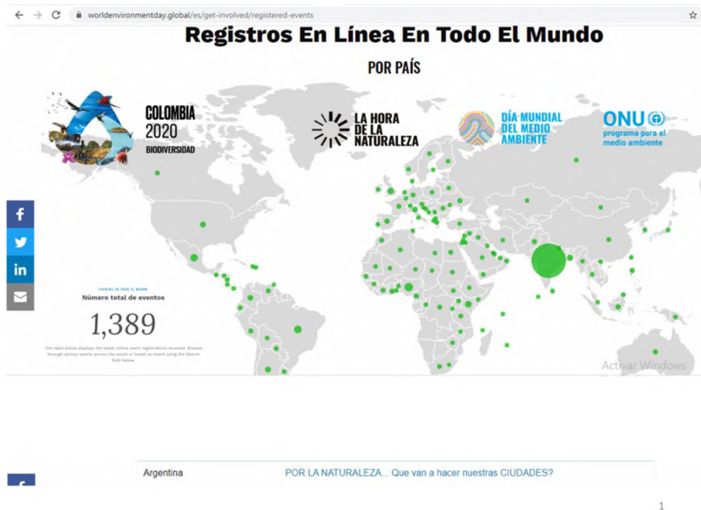
Figura 2: Registros en línea Día Mundial del Ambiente.

Relacionaron esos nuevos desafíos en los escenarios de las post pandemias con algunas temáticas que se trabajan desde la Facultad de Arquitectura y Urbanismo de la Universidad Naciona del Nordeste a través de proyectos de investigación, extensión y transferencia tecnológica, a fin de encontrar posibles aportes que se puedan realizar para las ciudades de la región. Figura 2.