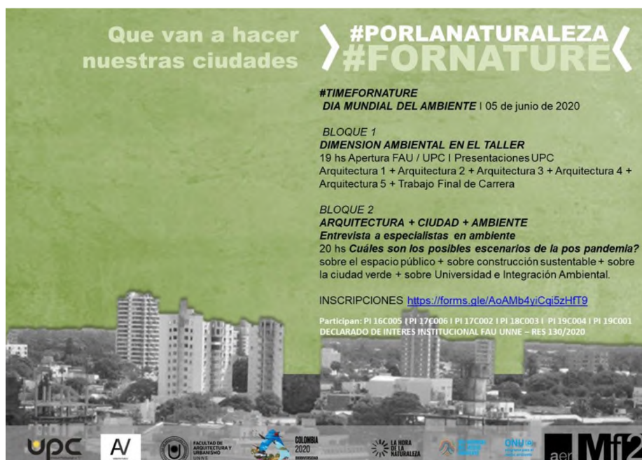
Figura 1: Que van a hacer nuestras ciudades. Caratula de Presentación.

Esta actividad será planteada como una exposición de cada nivel sobre su forma de abordaje e incorporación de la dimensión ambiental en el taller. La jornada se cerrará con una encuesta que posibilitará una nueva lectura de la implementación de la dimensión ambiental en el Taller desde la visión de los estudiantes a realizarse para el cierre del ciclo lectivo.