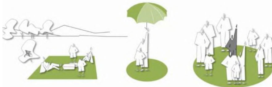
Figura 5: El diseño de Espacios Exteriores. Fuente: ASHIRA. Redibujado Catedra Morfología 2 Fau UNNE.

Se requiere pensar las interfaces entre lo que estamos viviendo y lo que viene después, con el fin de pensar en otras opciones de cómo incorporar mayor cantidad de ofertas de espacios verdes a las ciudades, espacios de distintas dimensiones, de distintas características, de distintos usos, y con usos diferenciados. Despararramar sobre la trama urbana miniplazas, buscar cada intersticio de la trama urbana para generar lugares donde la gente pueda recrearse. Generar espacios intermedios, entre los grandes espacios públicos, para descongestionar la concentración de personas en pocos espacios públicos, sin afectar el goce del espacio urbano. En ciudades intermedias, donde se verifican veredas de mayores dimensiones, se podría pensar en la escala humana, transformándolas en espacios de esparcimiento y disfrute además de circulación.