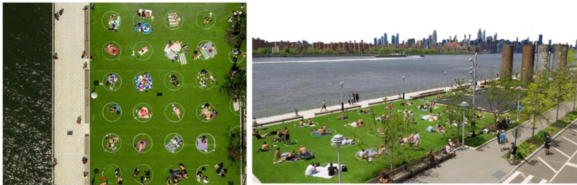
Figura 4: Espacio Publico. Domino Park, Brooklyn, Nueva York. Nuevo orden de ocupación.

donde surgen las demarcaciones a través de círculos estampados en la superficie, con las delimitaciones del distanciamiento social.