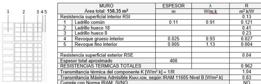
Figura 2. Planilla tipo para la determinación del "K" de los componentes murarios. Ej.: Muro tipo "A".