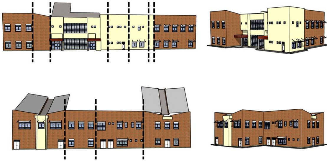
Figura 1. Despiece de la envolvente del edificio.

El procedimiento de relevamiento constó de las instancias de recolección de datos gráficos y técnicos, el croquisado y fotografiado, la medición in situ y la representación gráfica del edificio en general (fig. 1) y los detalles necesarios para los cálculos particulares de pérdidas térmicas.