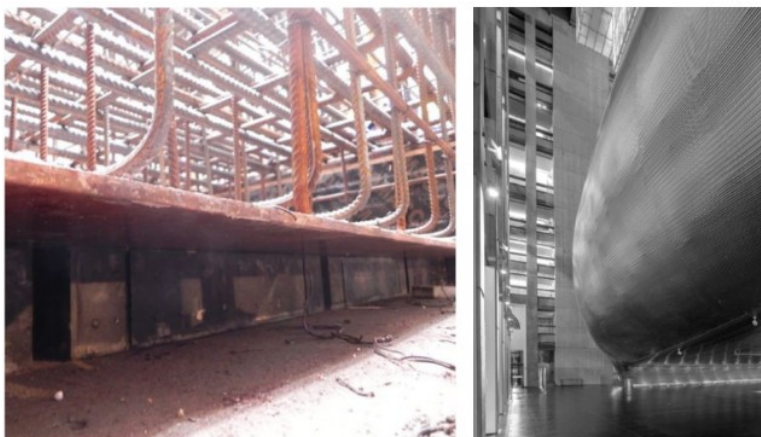
Figura 5 (izq). Muestra las almohadillas de goma sobre las que se montan las columnas.

Considerando estos valores, y con la intención de cumplir con los criterios NC 18 (Noise Criterion Curves), el equipo de proyecto consideró separar el auditorio de la estructura del edificio. Para lograr este objetivo, se emplearon muros dobles de hormigón con cámara de aire, además de pesadas aberturas y un sistema estructural diseñado para aislar las vibraciones. Este sistema consiste en tres columnas apoyadas sobre asientos de goma, que contribuyen a minimizar las perturbaciones acústicas y mejorar la calidad del ambiente interior (Figura 5). Consecuentemente, se logró una frecuencia de resonancia de 6 Hz en situación de sala llena (Basso, 2021).