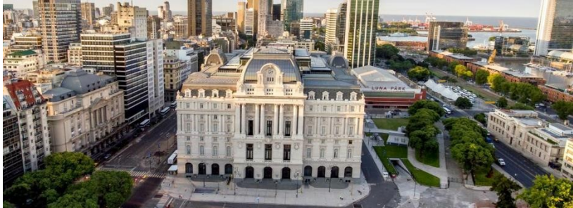
Figura 1. Vista del CCK.

Becker (2021) menciona que todos estos nuevos espacios provocan un fuerte contraste con el cierre perimetral existente, el cual se preserva en forma integral.