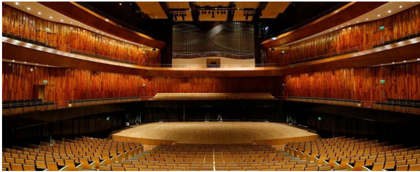
Figura 4. Sala de la Orquesta Sinfónica Nacional. Auditorio Nacional la Ballena Azul.

Según Becker (2021), las necesidades del acondicionamiento acústico, respecto al volumen de aire necesario por espectador, requirieron de una sala con mayor altura. Por tal motivo, se modificó el proyecto y se reestructuró el Chandelier dando por resultado el "engorde" de la ballena.