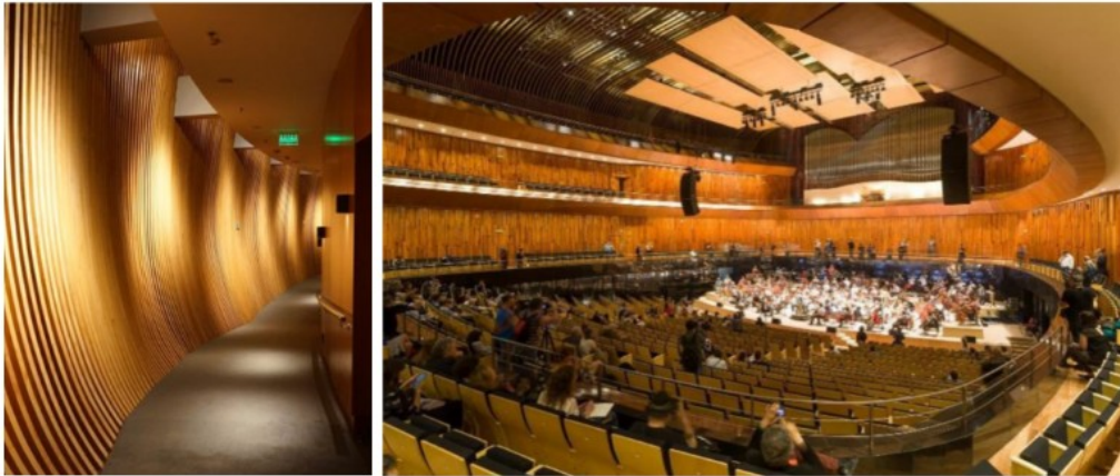
Figura 7 (izquierda). Indica los pasillos de circulación que actúan como cámara de reverberación.

llegaría muy tarde a una butaca, es decir, se percibiría como un eco. Para esto se idearon las circulaciones por fuera. La idea no solo redujo la dimensión –en ancho– de la sala, sino que además se logró una cámara de reverberación (Figura 7).