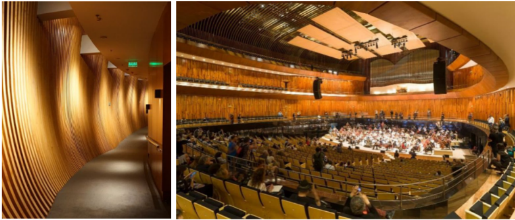
Figura 7 (izquierda). Indica los pasillos de circulación que actúan como cámara de reverberación.

llegaría muy tarde a una butaca, es decir, se percibiría como un eco. Para esto se idearon las circulaciones por fuera. La idea no solo redujo la dimensión –en ancho– de la sala, sino que además se logró una cámara de reverberación (Figura 7).