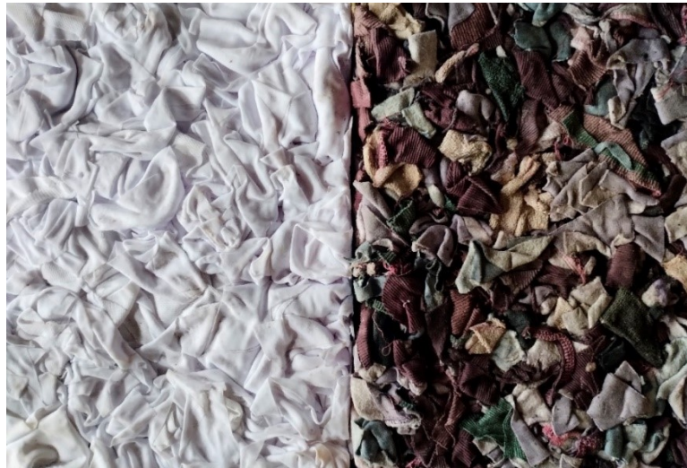
Figura 2: Placa con recortes pequeños (izquierda) con recortes mayores (derecha).