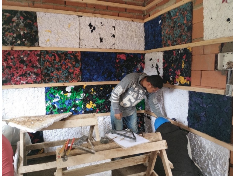
Figura 4: Colocación de las placas térmicas.