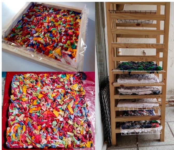
Figura 3: Dos modos de secado: en molde (izquierda arriba y abajo) y sobre rack y rejillas (derecha).