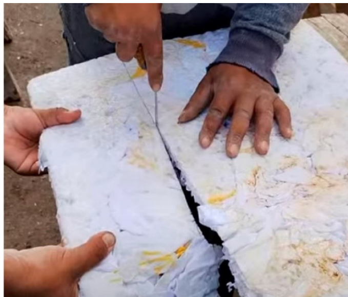
Figura 5: Corte de las placas térmicas.

En la aplicación de las placas, varias se tuvieron que cortar para completar distintos espacios y se experimentó su comportamiento al corte y también al agujereado. Ambas acciones se hicieron con mucha facilidad. Para el corte se usó cutter y cuchilla, y mientras estaban afilados no se presentó ningún problema y el desprendimiento de material fue mínimo (Figura 5). Incluso en una de las placas se hizo un corte circular donde pasaba el año de ventilación y el trabajo se hizo fácilmente. En cuanto al agujereado, usando la agujereadora los huecos se hicieron muy rápido y fácil y también la colocación de clavos.