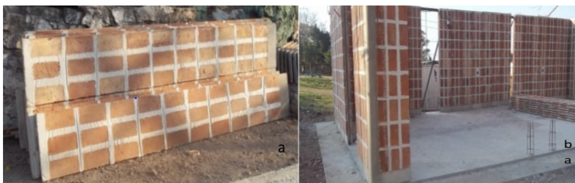
Figura 1. a) placa BENO. b) Construcción con sistema de muro BENO.

Los elementos constructivos del sistema BENO, son placas premoldeadas fabricadas en un molde, donde se colocan 24 mampuestos tipo bovedillas, con una junta de mortero con armadura interior de acero estriado de 4,2 mm. Las placas tienen una dimensión normalizada de 0,43 x 2,27 m y un peso aproximado de 65 kg, donde cerca del 50% corresponde a la estructura de vinculación y el otro 50% a los mampuestos, figura 1a. Las placas se erigen sobre un nervio en la platea de forma doble, con las caras vistas de los mampuestos hacia afuera, y resulta conveniente completar con un revestimiento o revoque, usando de relleno algún material aislante, generalmente Poliestireno expandido de 15 kg/m 3 de densidad, en lo que comprende el muro BENO, Figura 1b.