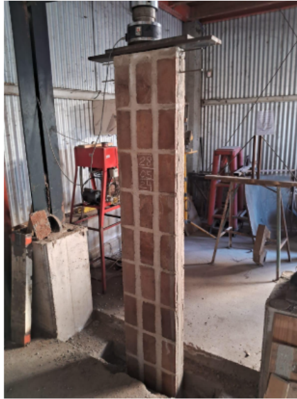
Figura 4. armado del muro BENO con bovedilla en la zona de prensado.