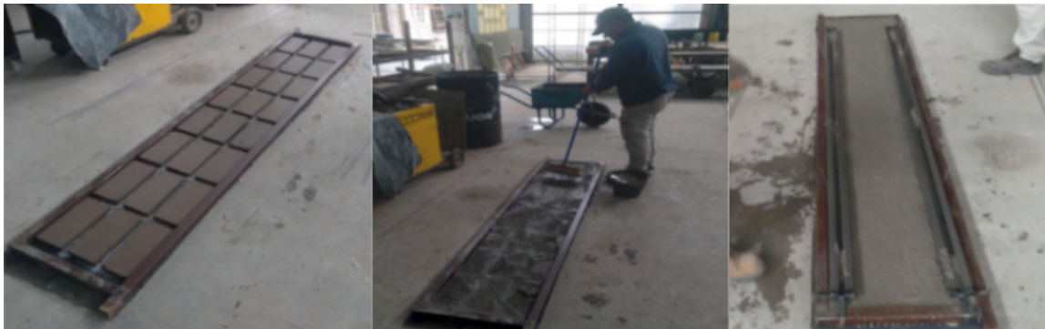
Figura 3. Secuencia de fabricación de la placa BENO.

La Figura 3 muestra partes del proceso de elaboración de la placa BENO con bovedilla-BTC.