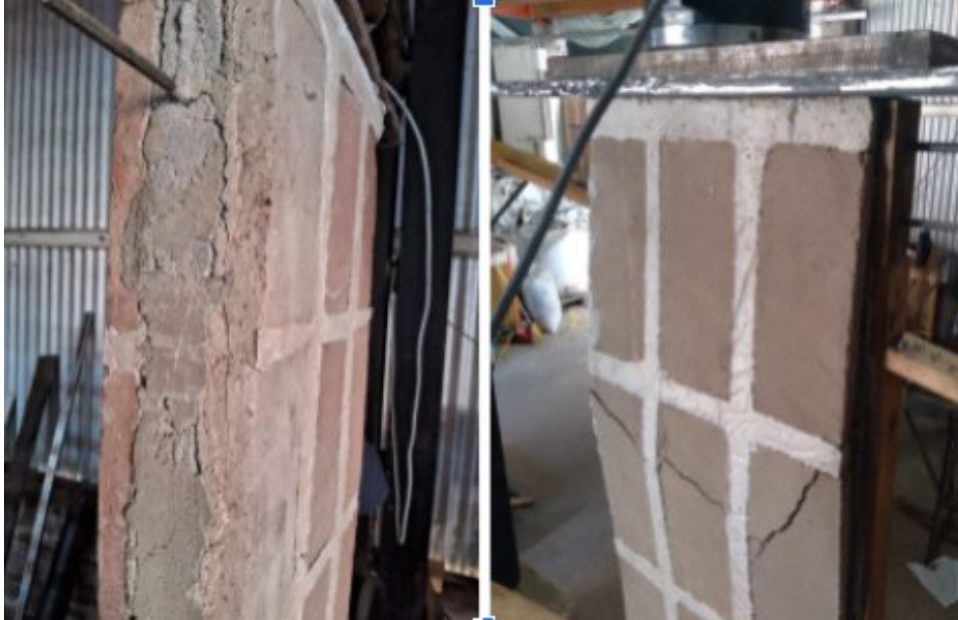
Figura 5. a) rotura del muro BENO. b) rotura del muro BENO-BTC.

produce el colapso (3,48 MPa) y la carga cae a 16500 kgf mostrando una falla en el mortero de unión del encadenado, figura 5a. Los muros BENO-PET y BENO-APR, mostraron valores bastante similares de resistencia, por encima de los 3 MPa, como así también del tipo de falla en la zona del encadenado superior. El caso más relevante fue el del muro BENO-BTC, que mostró un valor significativamente menor a los demás. En este caso, a diferencia de los otros, la falla se produjo en las bovedillas de la segunda fila y no en el encadenado y el muro colapsó a 1,61 MPa, figura 5b.