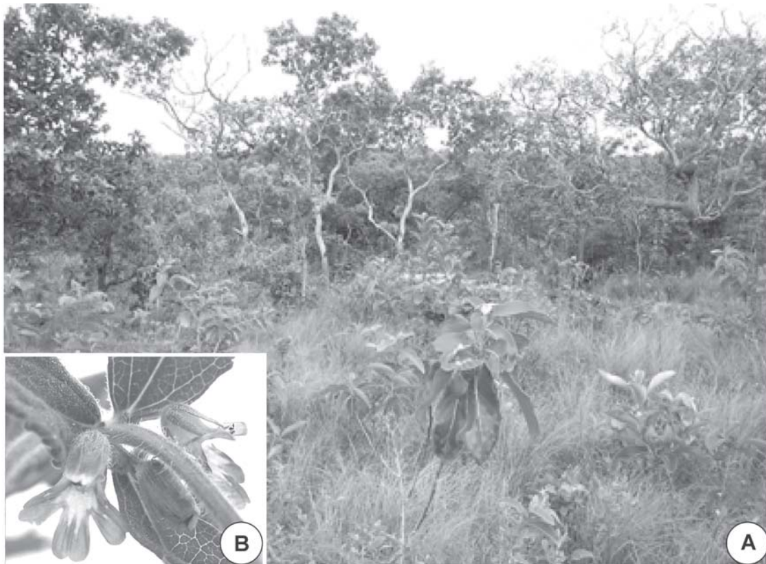
Fig. 2. A: cerrado húmedo donde crece Stemodia pratensis en Bolivia. B: detalle de una rama florífera de Stemodia pratensis .