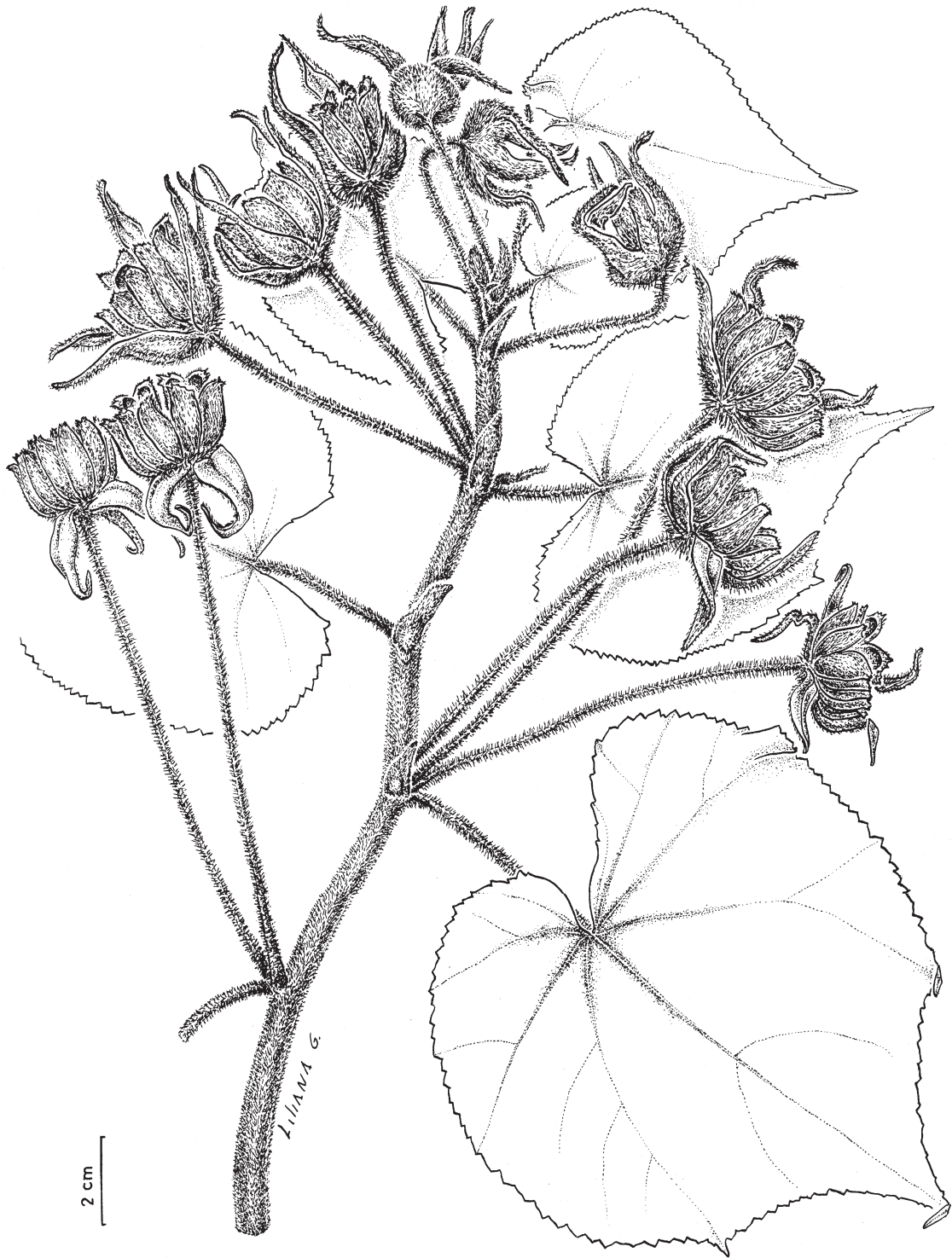
Fig. 1. Spirabutilon citrinum , rama (Pirani 166).