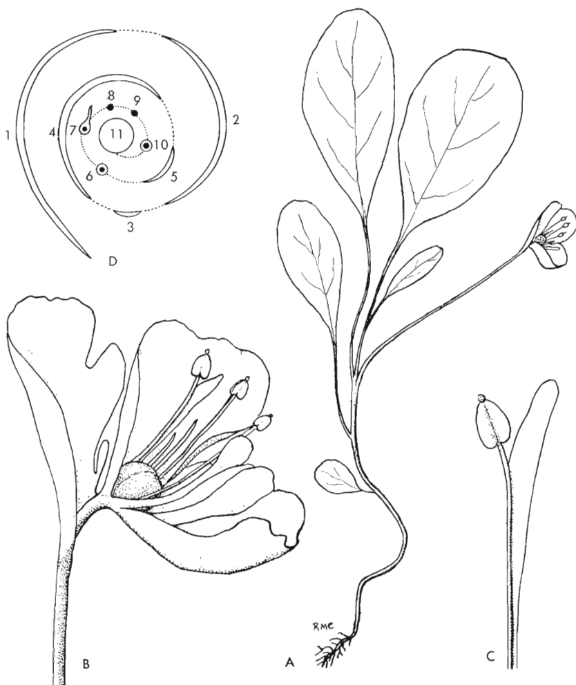
Fig. 1.— Nicotiana rustica : A, aspecto de la planta con floración prematura (X 0,5); B, flor teratológica (X 2); C, estambre con enación petaloide (X 3); D, diagrama mostrando la disposición espiralada de las piezas florales (explicación en el texto).