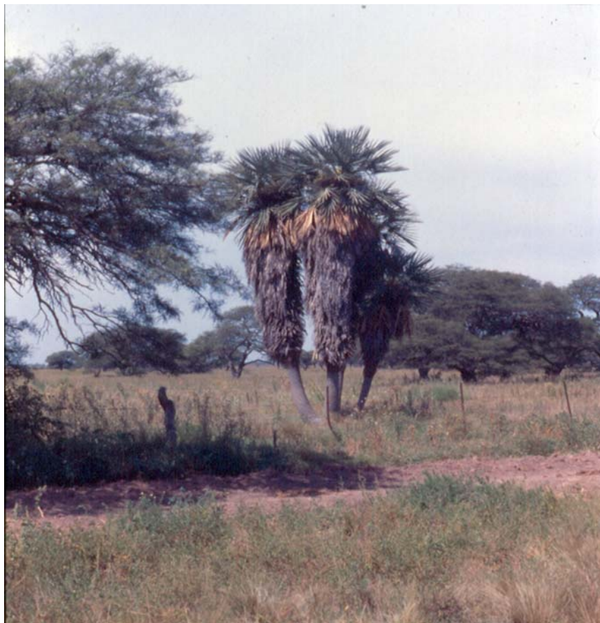
Fig. 2. Trithrinax campestris en Ballesteros, prov. Córdoba.