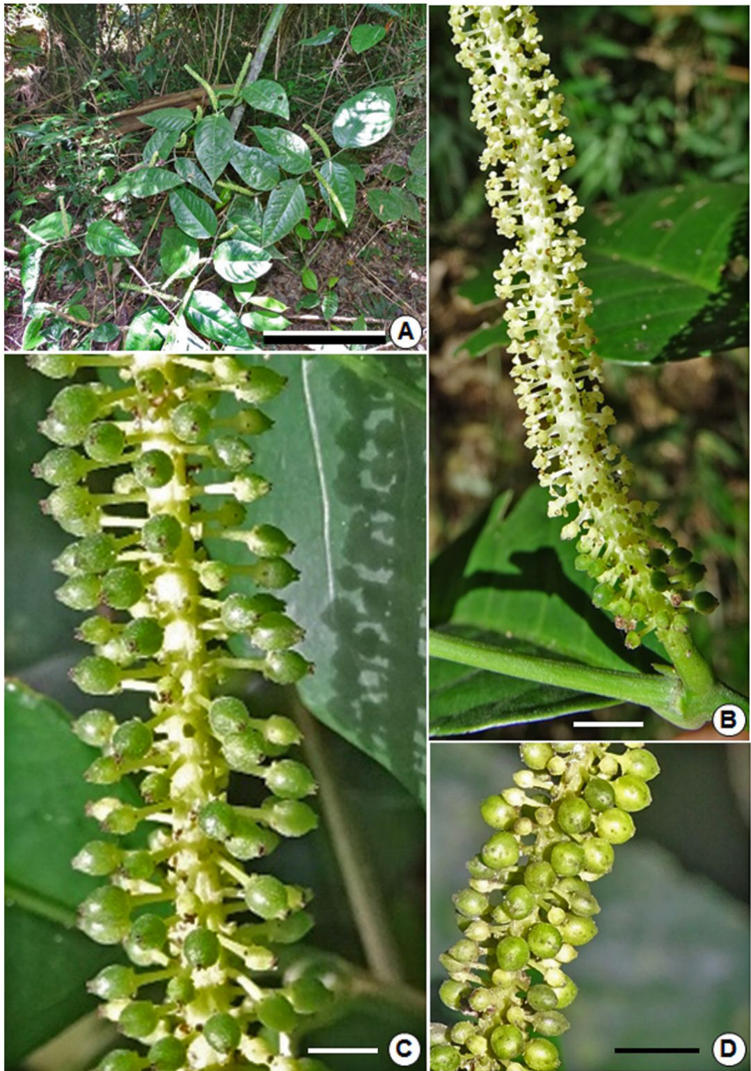
Fig. 1. Piper miquelianum . A: Planta. B: Inflorescencia. C: Infrutescencia inmadura. D: Infrutescencia madura. Escalas: A: 30 cm; B, D: 5 mm; C: 2,5 mm.