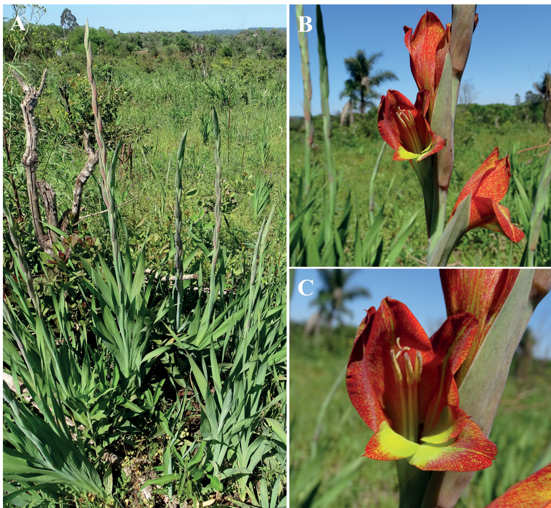
Fig. 1. Gladiolus dalenii . Plantas naturalizadas en Misiones. A: Plantas con espigas en desarrollo. B: Detalle de flores en la espiga. C: Detalle de la flor.