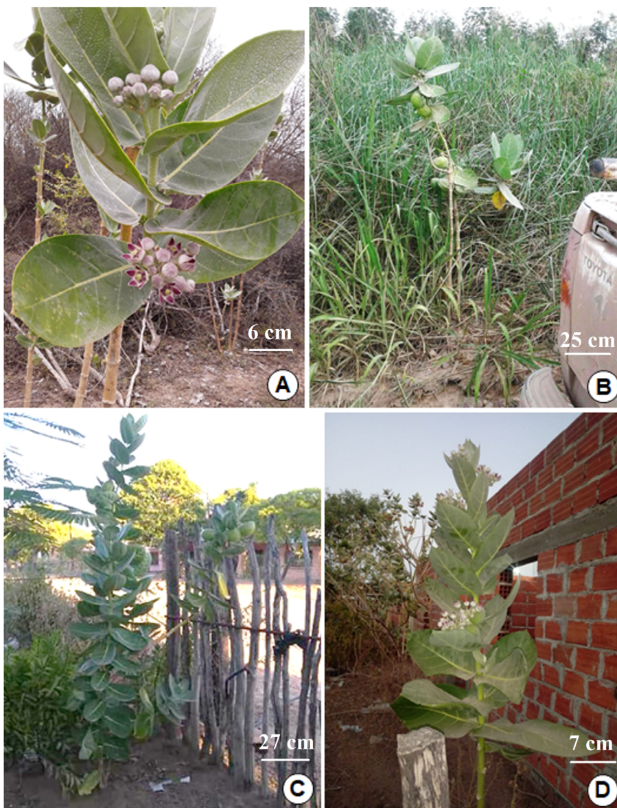
Fig. 2. Sitios donde Calotropis procera crece espontáneamente. A: Borde de bosque chaqueño. B: Borde de caminos. C-D: Alrededor de vivienda.

Calotropis procera se naturalizó en bordes de áreas desmontadas (Fig. 2A), ambientes antropizados como orillas de caminos (Fig. 2B), en los alrededores de las viviendas (Fig. 2C-D), baldíos, peladares y bordes de basurales. Crece