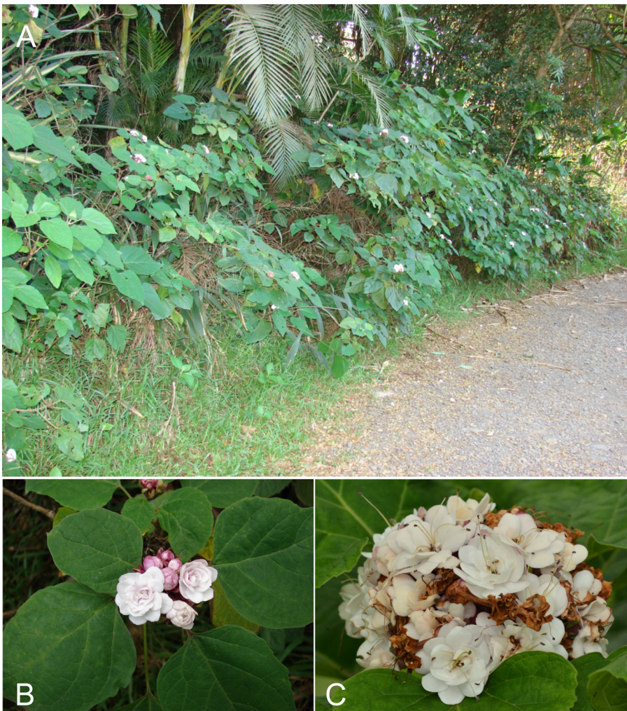
Fig. 2. Clerodendrum chinense . A: Hábito. B: Aspecto general de la inflorescencia y hojas. C: Detalle de la inflorescencia.

O'Leary (2018: 197) indica que la cita de esta especie para la Flora Argentina, proviene de material de herbario cultivado. Sin embargo, los ejemplares examinados para este trabajo, no presentan ninguna inscripción en su etiqueta