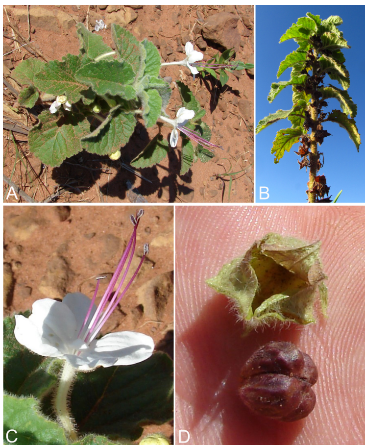
Fig. 3. Clerodendrum ekmanii . A: Hábito. B: Aspecto general, mostrando las inflorescencias axilares. C: Detalle de la flor. D: Cáliz (arriba) y fruto (abajo).

Distribución geográfica y ecología: Especie nativa del centro-oeste y sur del Brasil (Harley et al., 2015), centro-oeste de Paraguay y noreste de la Argentina; crece entre los 0-500 m (O’Leary, 2018; Zuloaga et al., 2019).