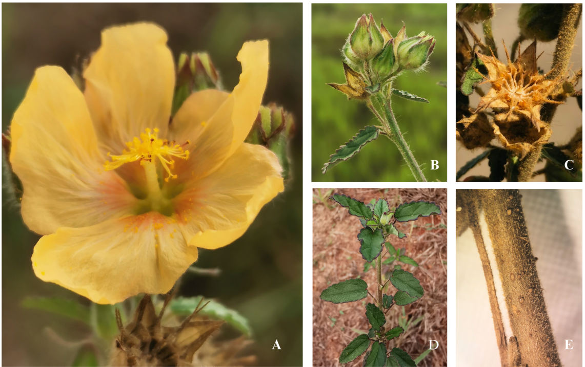
Fig. 1. Sida cerradoensis . A: Flor en antesis. B: Botones florales mostrando el cáliz y parte del tallo. C: Esquizocarpo. D: Rama terminal. E: Detalle del tallo. A-E: A. Torrejano-M et al. 1004; créditos fotográficos: A. Torrejano Munevar.

dientes irregulares; venación impresa adaxialmente, prominente abaxialmente, nervios de primer orden actinódromos con 5 nervios basales, 3-5 pares de nervios de segundo orden, semi-craspedódromos; cara adaxial cubierta por indumento estrellado con tricomas 2-4 radiados, cara abaxial cubierta por indumento estrellado con tricomas 7-8 radiados, en la lámina y 2-5 radiados en las venas; estípulas libres, filiformes, enteras, persistentes, 3-8 mm long.; pecíolo 4-13 mm long., sulcado, indumento estrellado, con tricomas 2-4 radiados, mezclados con tricomas simples, 1,5-2 mm long. Flores solitarias, axilares o en glomérulos apicales; pedicelo 3-16 mm long., articulado, cubierto por indumento estrellado, tricomas 2-4(5) radiados hialinos, mezclados con tricomas simples hialinos; cáliz no acrescente, 9-10 mm long., 10-costillado, lóbulos triangulares, 4-6 mm long., cubiertos por indumento estrellado con tricomas 2-5 radiados, combinado con