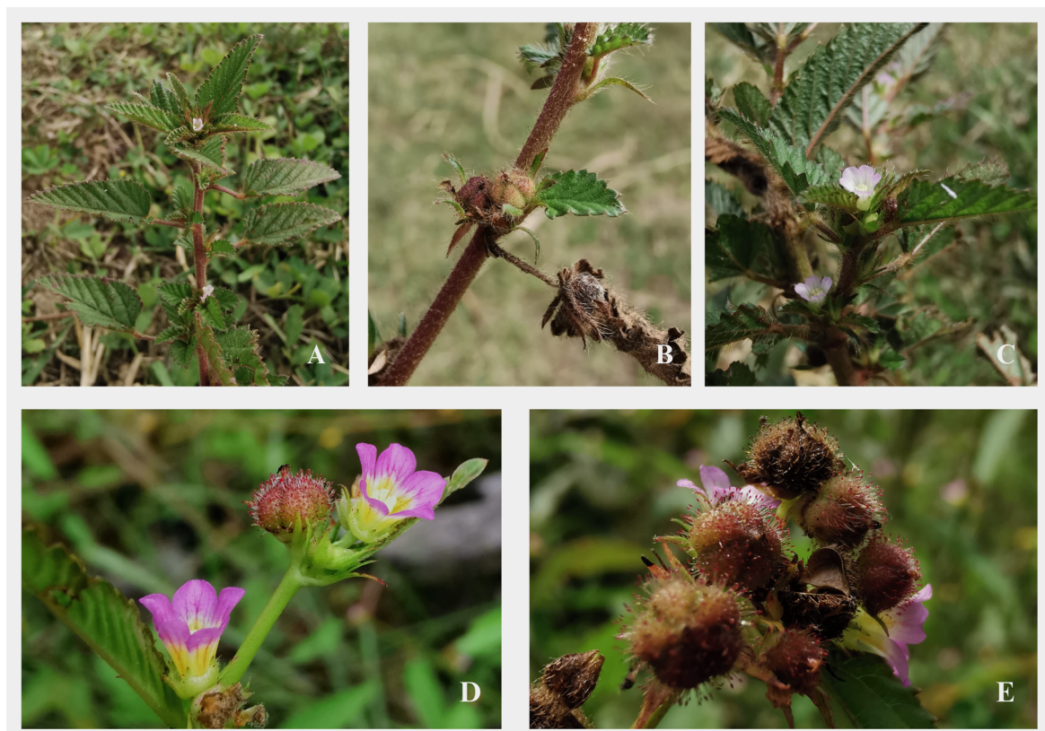
Fig. 3. Melochia melissifolia . A: Rama terminal. B: Fruto. C: Flor en antesis. Melochia siphonandra . D: Flor en antesis y fruto. E: Frutos maduros.

Especie de amplia distribución, presente desde México, Cuba a Colombia, Ecuador y el norte de Brasil (Goldberg, 1967). Anteriormente