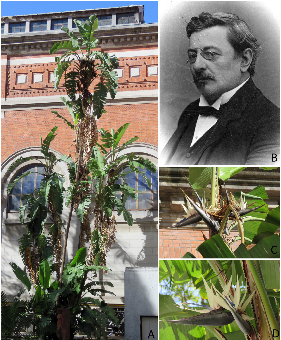
Fig. 1. A: Strelitzia nicolai , colección viva del Jardín Botánico y Arboretum del MACN. B: Retrato de Eduardo L. Holmberg, AGN. C-D: Detalles de las inflorescencias.