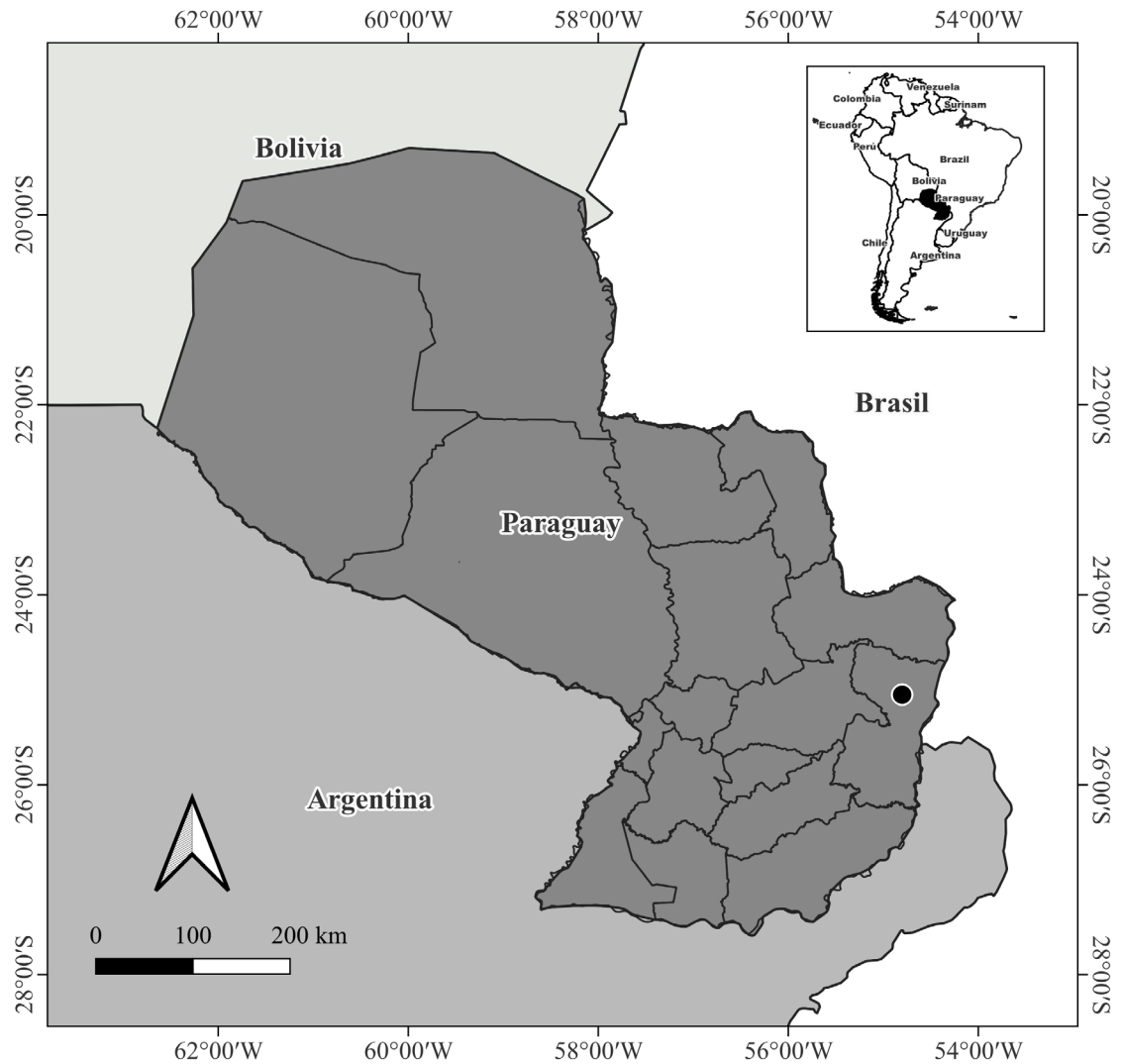
Fig. 2. Mapa de Paraguay que muestra el sitio de colecta de Lilium regale en el Departamento de Alto Paraná (círculo negro).

toda especie bulbosa, presenta también reproducción vegetativa en las inmediaciones de las plantas establecidas, lo que favorece la formación de poblaciones que se expanden gradualmente en los sitios de dispersión. De acuerdo con Ying et al. (2014), la fragancia de sus flores atrae insectos polinizadores, los cuales contribuyen a la fertilización cruzada. Los registros en la región sugieren que la dispersión de esta especie podría estar asociada al transporte vehicular de semillas, encontrándose condiciones ambientales favorables para su establecimiento en los