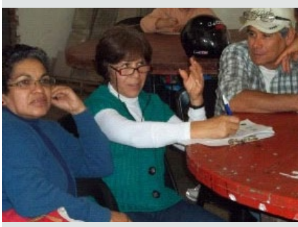
[3] Productores respondiendo la encuesta.

¿Sabes qué fines se les puede dar a los residuos orgánicos?