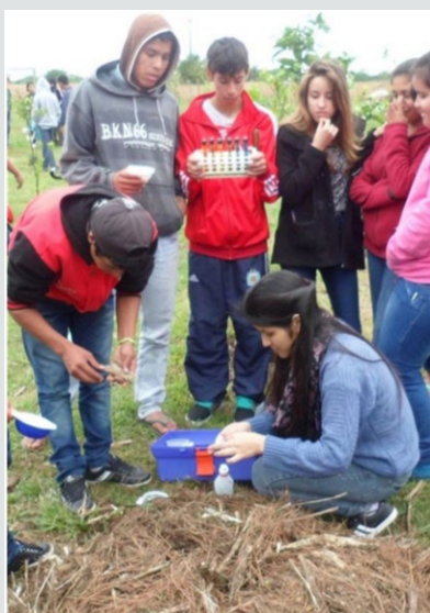
[4] Alumna de grado dirigiendo durante la práctica de compostaje.

El IPUR-BAT intenta, con la implementación de actividades como la que presentamos, contribuir a la incorporación del paisaje en la planificación territorial de la ciudad de Resistencia, conociendo las cualidades de su paisaje característico, sus valores, debilidades y dinámica en relación a otros factores intervinientes, promoviendo la aplicación de nuevos instrumentos necesarios para la toma de decisiones en la tarea de planificación y renovación del paisaje urbano, en busca de sustentabilidad económica, ecológica y cultural. ■