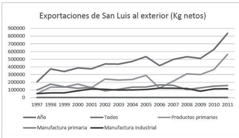
Figura 1 - Fuente: elaboración propia sobre la base de datos del INDEC-OPEX