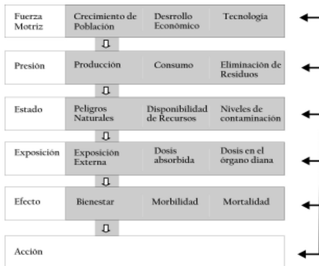
Cuadro 3: Marco causa-efecto para la salud y el ambiente