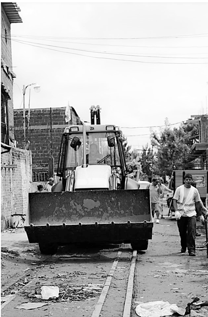
Figura 6. Topadoras en la villa 21-24 durante una de las etapas de relocalización al complejo urbano Padre Mugica (Instituto de la Vivienda de la Ciudad, 2014)

Por otra parte, se llevaron adelante repertorios de acción colectiva novedosos, dirigidos centralmente al Poder Judicial federal. En este punto, es necesario aclarar que una de las complejidades principales de la causa “Mendoza” para los afectados —que incidió en todo momento en su peso en el condicionamiento de las políticas que se derivaron de ella— fue que no figuraban como “partes” en el litigio. De esta forma, actuaron en los intersticios del campo jurídico. No pudieron participar de las audiencias públicas convocadas por la CSJN, pero accedieron a abogados patrocinantes que presentaron pedidos de informes, notas y otros recursos legales para hacer escuchar su voz. Por otra parte, llevaron adelante acciones directas que buscaron interpelar a los magistrados: se hicieron presentes y reclamaron ser escuchados en las audiencias públicas, y le presentaron semanalmente en persona pedidos de informe al presidente de la CSJN, entre otras acciones. Estos repertorios resultaban novedosos, en tanto los delegados no tenían experiencias previas de vinculación con la justicia federal argentina.