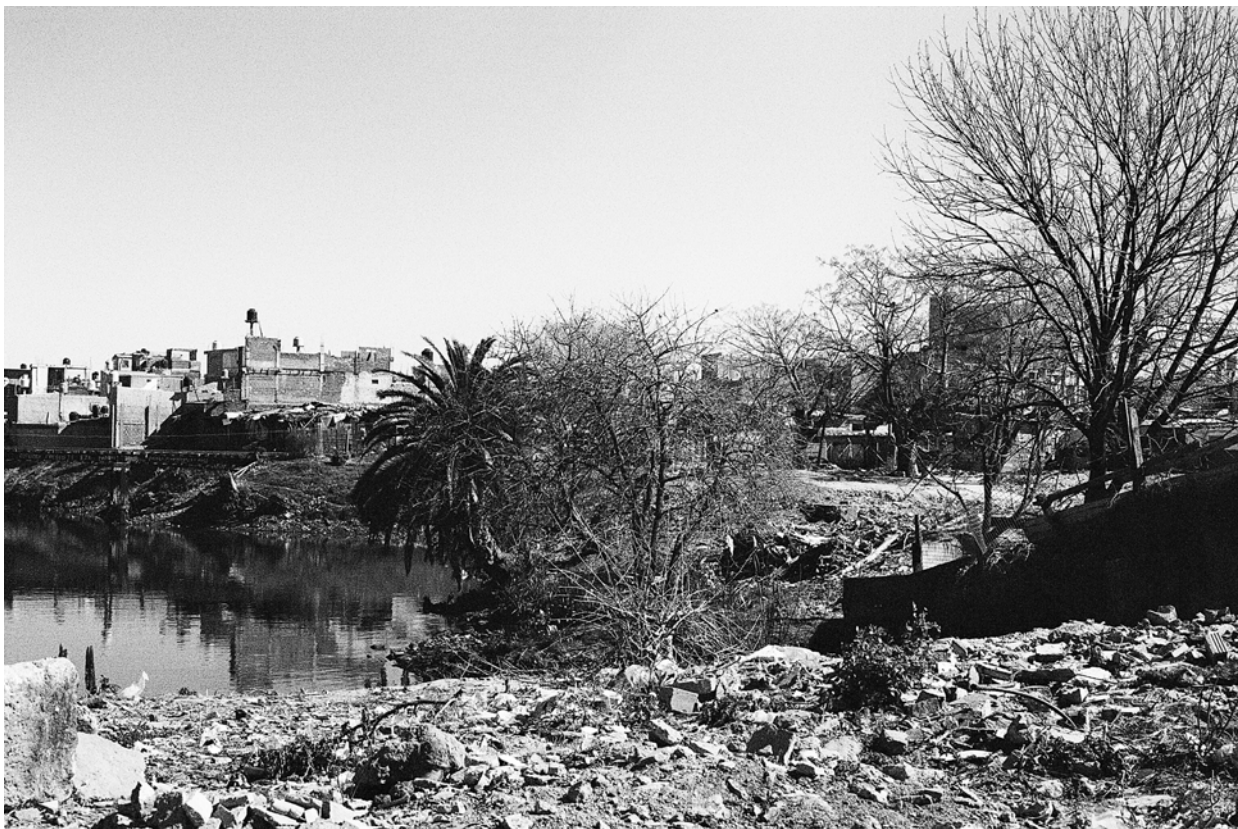
Figura 5. El “camino de sirga” de la villa 21-24 (FAINSTEIN, 2016)

personas supone una transformación profunda de sus estrategias “adaptativas” (BARTOLOMÉ, 1985; BRITES, 2004). Esto se expresa en un hecho social que desarma las formas simbólicas mediante las cuales los colectivos entienden su medio ambiente físico y social, y produce una “pérdida del espacio socialmente construido” (CATULLO, 2006). En las relocalizaciones se provocaría una desconfiguración de estos marcos de la acción, con lo cual los efectos irían más allá de lo material e impactarían en las identidades individuales y colectivas de la población.