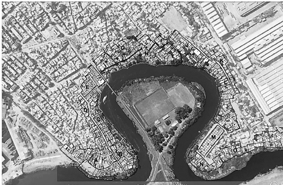
Figura 4. “Camino de sirga” de la villa 21-24 de Barracas (IVC, 2011)