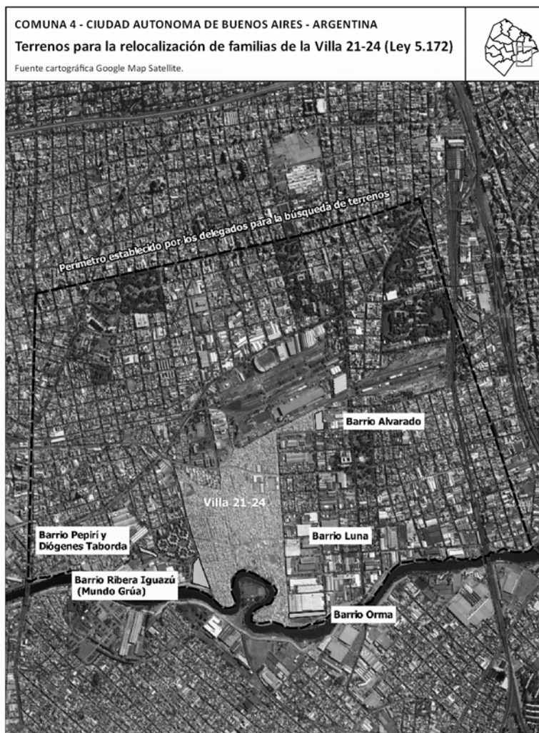
Figura 8. Terrenos estipulados para las nuevas viviendas de las familias del “camino de sirga” de la villa 21-24, según la Ley N.º 5172 (elaborado por Infohábitat sobre la base de información de la Ley N.º 5172, 2014)

Luego de esta experiencia, los referentes y sus asesores legales buscaron terrenos cercanos a la villa 21-24 de Barracas que fueran propiedad del gobierno porteño y en los que se pudieran construir las nuevas viviendas, redactaron el proyecto y realizaron el lento trabajo de comunicarlo a los legisladores de la ciudad. Participaron de una audiencia pública en la Legislatura, en la que diversos actores del barrio expresaron sus argumentaciones, e invitaron a legisladoras a sus asambleas barriales, entre otras múltiples acciones. Finalmente, la ley fue aprobada a finales de 2014.