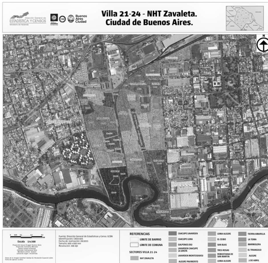
Figura 3. Mapa de la Villa 21-24 y el NHT Zavaleta (GCABA, 2015)

Casi treinta años después, se ordenó la relocalización del sector del asentamiento ubicado dentro del denominado “camino de sirga” del Riachuelo (debe decirse que el plan de saneamiento también estipulaba la urbanización del barrio en su conjunto).