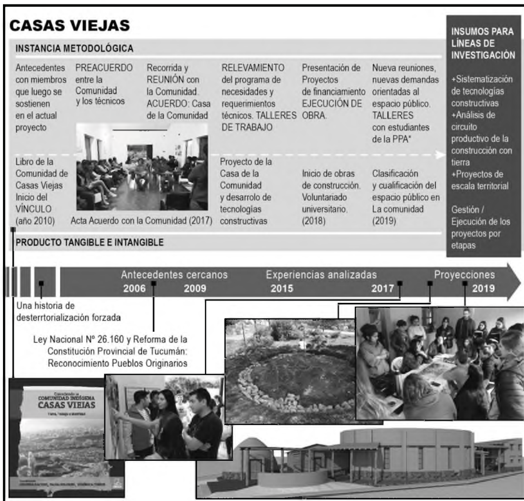
Figura 3. Cronología de la experiencia en la Comunidad Indígena Casas Viejas: fases del proceso participativo desarrollado y de la dialéctica entablada con la academia.