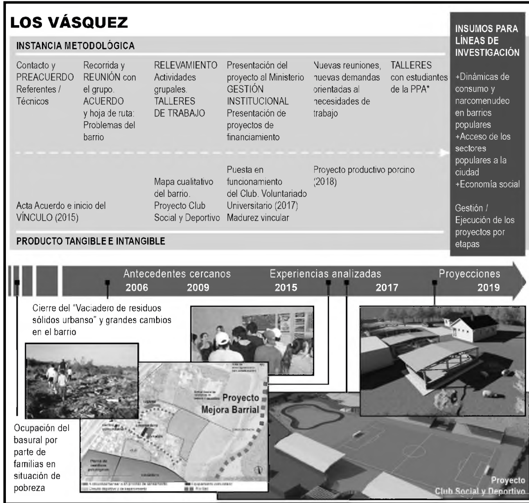
Figura 2. Cronología de la experiencia en el barrio Los Vásquez: fases del proceso participativo desarrollado y de la dialéctica entablada con la academia.