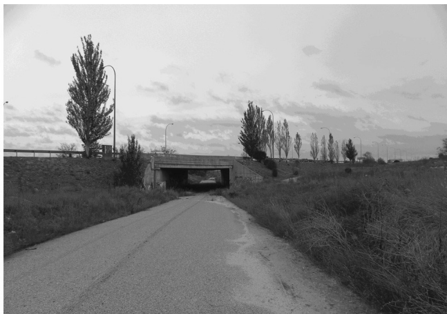
Ingreso al Barrio Ciudad de mis sueños, Córdoba, Argentina Córdoba, Argentina

rios. A su vez, a pesar de que en muchos casos se vieron mejoradas las condiciones materiales y constructivas de las viviendas y del barrio con respecto al que residían, en el caso cordobés los nuevos barrios carecen de valor relativo de suelo, situación que responde a que los terrenos donde se hallan ubicados están vinculados con un alto deterioro y contaminación ambiental. Es decir que en ambos casos la elección de los terrenos quedó supeditada al precio más barato, justamente porque poseen deficitarias condiciones urbanas y ambientales.