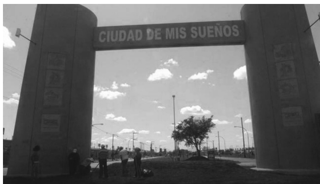
Único ingreso al BTE La Quinta, Madrid, España Fuente: Ph Ludmila Garbellotto. Madrid, España

En el caso de los barrios de tipología especial de Madrid, las viviendas colectivas estaban dispuestas a modo “pastilla”, planteada así para conseguir cierto control social entre los habitantes. Sin embargo, frente a las expectativas de esta disposición habitacional, solo se logró enfrentar a los vecinos que deseaban volver a la privacidad de sus anteriores viviendas.