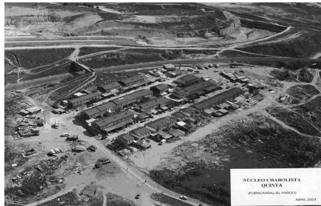
BTE La Quinta, Madrid, España