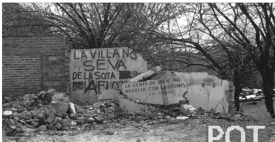
Reconfiguración del Estado // Modelos de Urbanización // Ciudades Fragmentadas // Pobreza y Estigmatización // Derecho a la Ciudad // Redes de Supervivencia // Prototipo de Resistencia

Escombros en las demoliciones de villa La Maternidad, Córdoba, Argentina