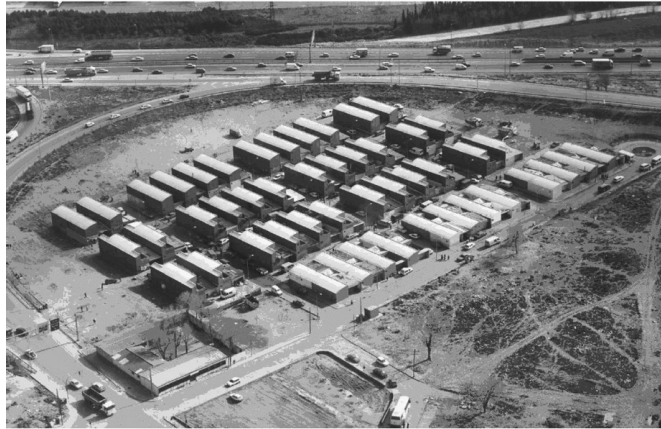
BTE Las Mimbreras, Madrid, España

En cuanto al equipamiento barrial, los barrios ciudades cordobeses fueron previstos del equipamiento que se consideraba necesario para abastecer a toda la comunidad realojada. Esto incluía dispensario de salud, centro comunitario, iglesia, equipamientos públicos (plaza, iglesia).