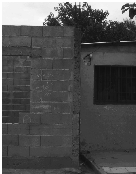
Ampliaciones autoconstruidas en Barrio-Ciudad de mis sueños, Córdoba, Argentina Fuente: Ph Ludmila Garbellotto. Córdoba, Argentina

A continuación se comparan las dimensiones analizadas en el apartado anterior de cada programa con los resultados y consecuencias ocurridas para ambos casos.