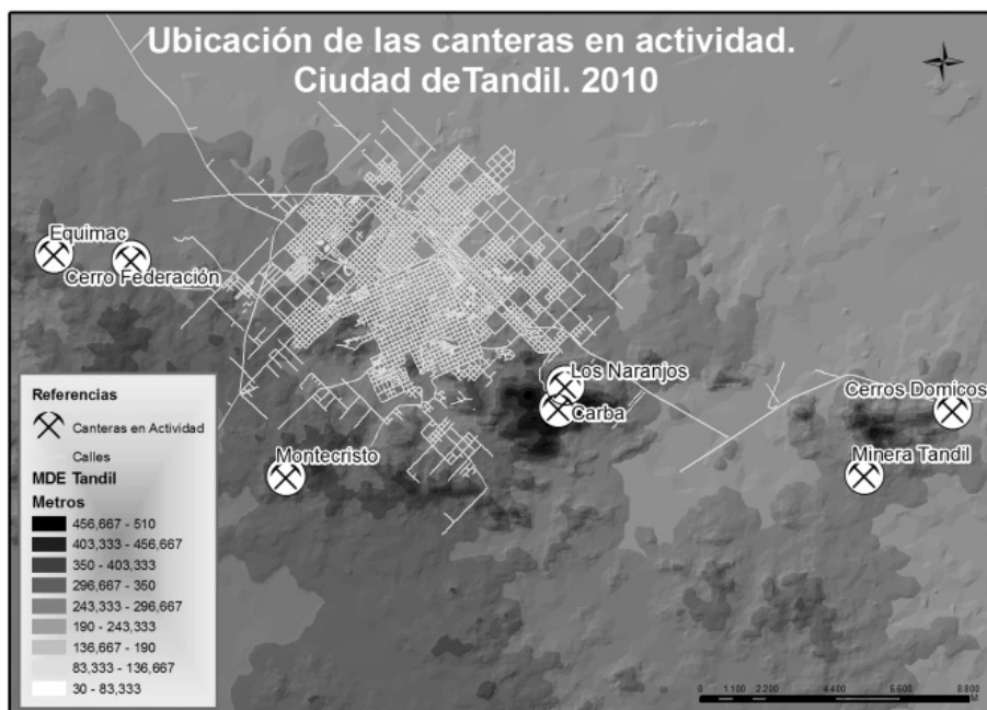
Figura N° 3

molida, internalizado como costo por la comunidad de Tandil y como beneficio por los contratistas de obra pública, los empresarios canteristas y otros sectores involucrados.” (FERNÁNDEZ EQUIZA, 2001: 32).