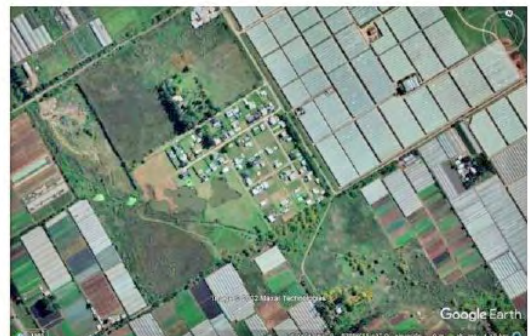
Figura 1. Ejemplos de tipos de loteos existentes.