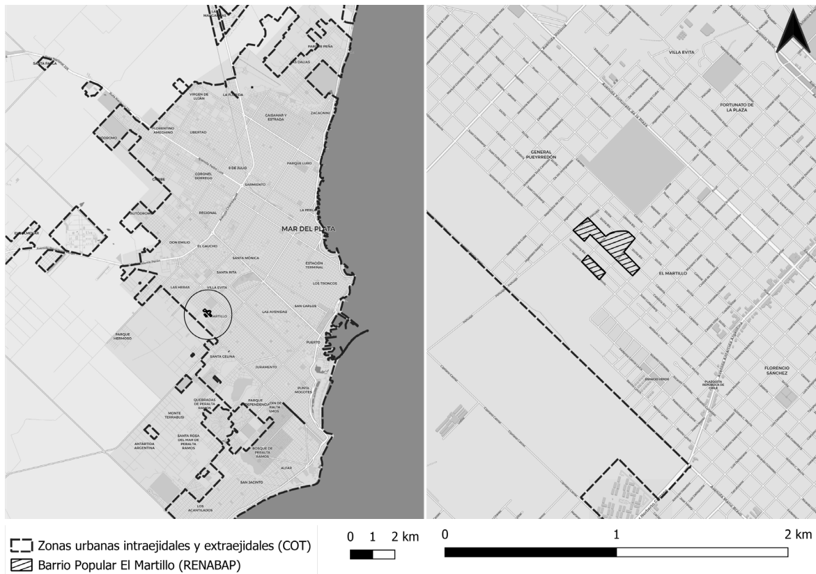
Figura 1. Mapa del BP El Martillo, Mar del Plata.

el MTE está haciendo 35 viviendas. Entre esas viviendas, el taller mecánico que pudimos tener propio, el productivo que tenemos acá de pilares y de medialunas donde apoyan los tanques, la carpintería, toda la parte administrativa y técnica debemos ser más o menos 150 trabajadores (Entrevista n° 1) 11