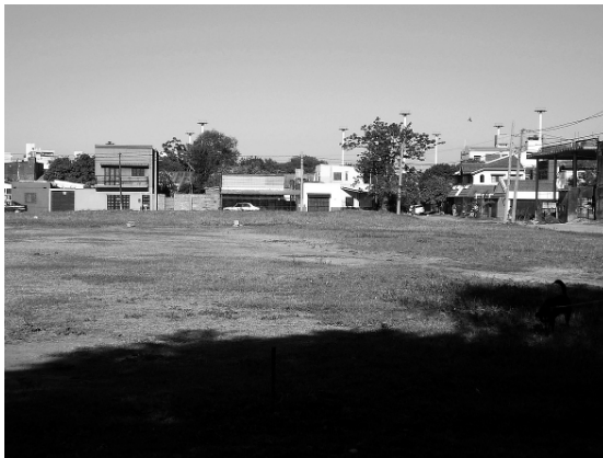
Espacio libre de edificación en el barrio San Benito, factible de ser afectado como espacio verde

colmada su capacidad, y por ahí entraría la necesidad de contar con otros espacios verdes y yo creo que cubriría esta expectativa la reciente habilitación de la costanera Sur...” . Se indica que los usuarios provienen también de otros barrios y se marca una gran expectativa por la presencia del nuevo paseo costero. Las características de estos espacios verdes, por ser inclusivos y colectivos, definen el alcance social que manifiestan, revelado por la apropiación de la comunidad y carácter que le otorga, respondiendo funcionalmente a la ciudad, por el grado de vinculación franca entre la población y el área verde. La democratización del espacio verde se manifiesta no sólo por la utilización por parte de los vecinos del barrio, sino también por la concurrencia de otros más alejados, con la pre-