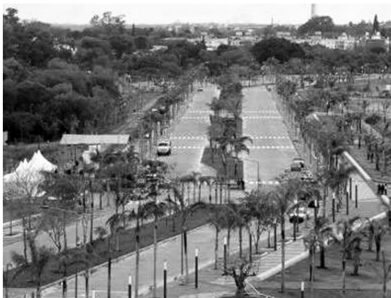
Avenida Costanera Juan Pablo II

* El barrio San Martín se posiciona como el de mayor déficit en cuanto a espacios verdes. El barrio Sur, según lo manifestado por la delegada municipal, al no contar con una comisión vecinal, carece de espacios verdes, aunque posee próximos en el vecino Verón de Astrada. El barrio San Benito carece también de espacios verdes, aunque su proximidad con la plaza Belgrano ubicada en el barrio Arazatí suple en cierta medida esta falencia.