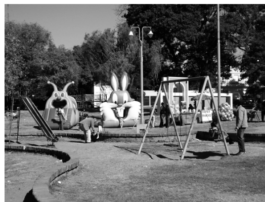
Parque Cambá Cuá