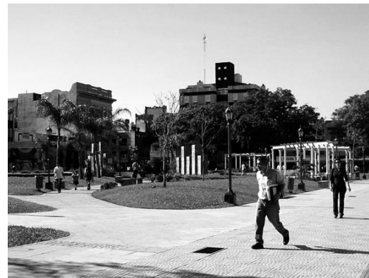
Plaza Juan de Vera