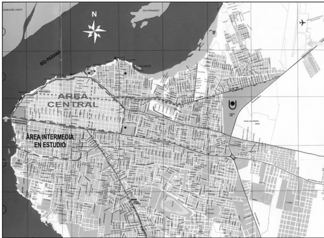
Ciudad de Corrientes. Ubicación del sector en estudio

La ciudad plantea una división en su estructura urbana que resulta de la ocupación de superficie construida y de la presencia de redes de infraestructura básica que sirven a los distintos sectores. En función de ello, esta división responde a la estructuración en área