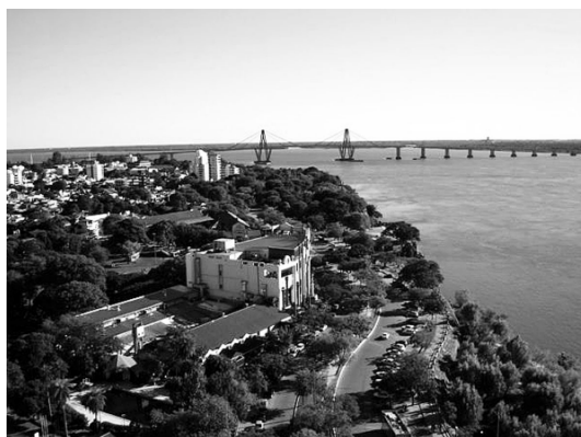
Av. Costanera General San Martín

Se observa que gran parte de los espacios verdes están localizados en el área central, sector delimitado por las avenidas Costanera Gral. San Martín, Plácido Martínez, Juan de Vera, Pujol, Artigas, Ferré y 3 de Abril, revelando la plena utilización recreativa en proximidades de la franja costera urbana. El río Paraná, protagonista del paisaje natural de la ciudad, genera en el habitante de Corrientes una atracción particular. En el año, principalmente durante los fines de semana, en mayor medida en horario vespertino durante el