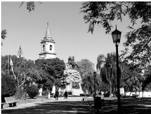
Plaza 25 de Mayo

Se hace destacable también la importante afluencia que denotan los parques Mitre y Cambá Cuá, ubicados próximos al paseo costero. La frondosa arboleda que posee el primero de ellos, sumada a la proximidad del río Paraná, lo convierten en uno de los espacios públicos tradicionales. La presencia de juegos infantiles, sectores destinados a la práctica deportiva, calles interiores que permiten el recorrido vehicular y la práctica aeróbica, tienden a democratizar el espacio verde, permitiendo la obtención de interesantes visuales del río y sus costas desde las puntas Mitre y de la Batería, y posibilitan la reunión social del ciudadano en contacto con la naturaleza circundante. El parque Cambá Cuá, localizado en uno de los bordes de la avenida costanera, complementa este paseo