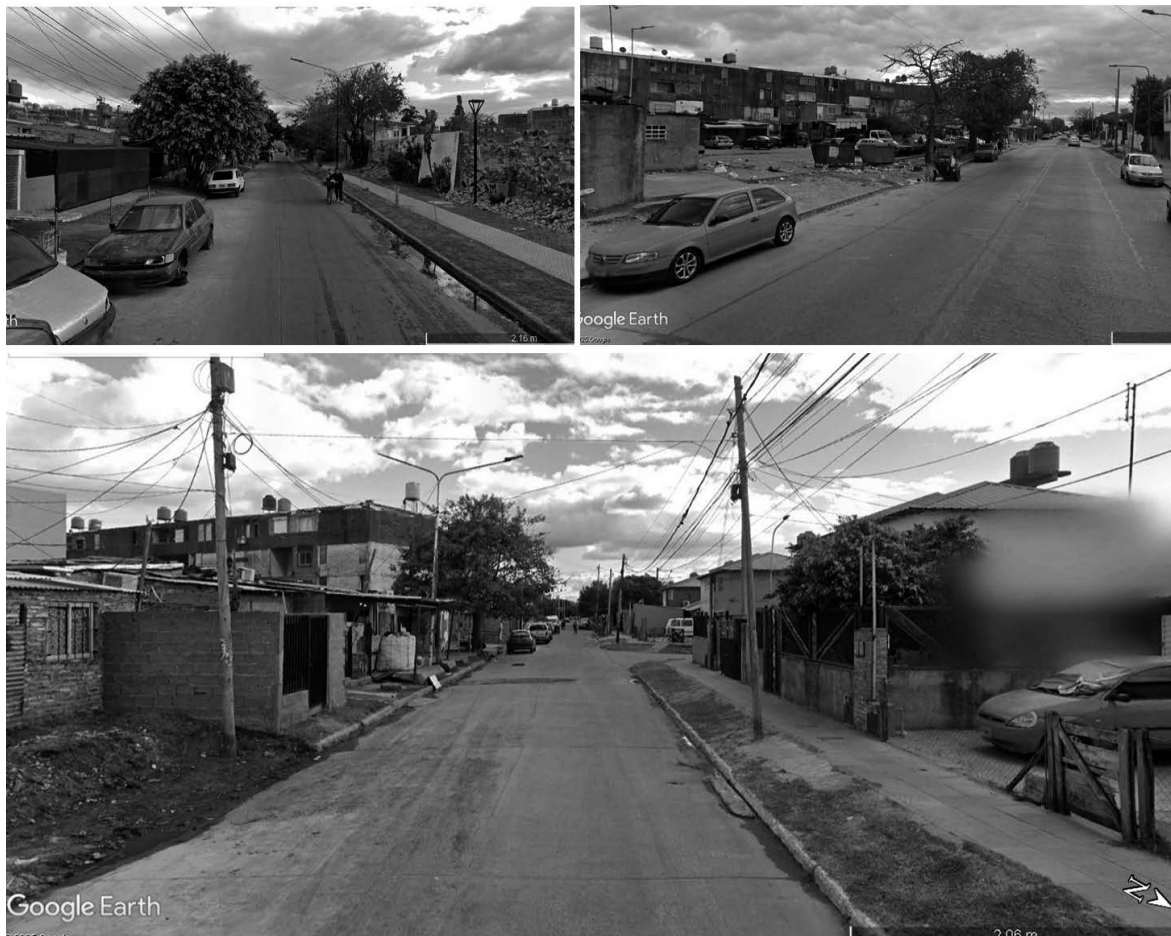
Figura 4 Calle Paraíso, Villegas y Av. Perdriel | discontinuidades en la movilidad peatonal

Fuente: Capturas propias realizadas mediante Google Street View. Fecha de acceso: mayo de 2025