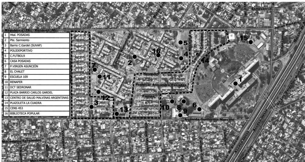
Figura 2 Barrio Carlos Gardel | principales referencias en proximidad