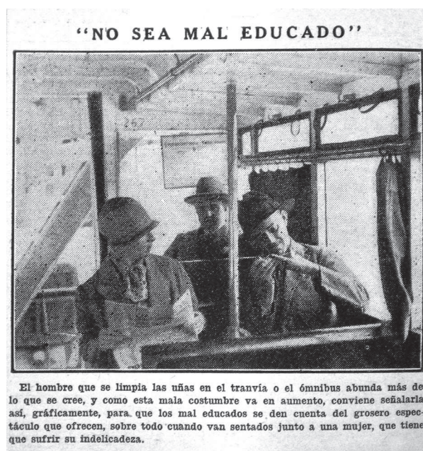
Figura 1. “El hombre de lee de ojito”

Otra fuente que resulta interesante analizar es la columna “Desde el mirador”, de EDUARDO ENCINA, publicada en Caras y Caretas a mediados de la década de 1920. Dedicada a comentarios variados sobre las interacciones en el espacio público, este tipo de columnas buscaba llamar la atención sobre conductas consideradas incorrectas frente a normas que no eran explícitas y que expresaban las ideas y valores del comentarista; no provenían de una autoridad como la compañía de transporte o la Municipalidad. Si bien no puede obviarse que quienes escribían en la prensa no estaban en igualdad de posición que el lector,