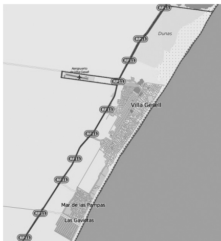
Mapa III. El partido de Villa Gesell y sus localidades

dimensión simbólica fundamental, ya que opera como frontera social, es decir, separa a dos grupos sociales en tensión: de un lado del bulevar, "los antiguos residentes": principalmente autodefinidos como de clase media, "ciudadanos de bien", portadores de apellido, dueños de la industria turística geselina y merecedores de la ciudad; y del otro lado, "los recién llegados": sectores populares, trabajadores del área de servicios, aquellos que son definidos por los "tradicionales residentes" como "intrusos" y, por tanto, no merecedores de la ciudad.