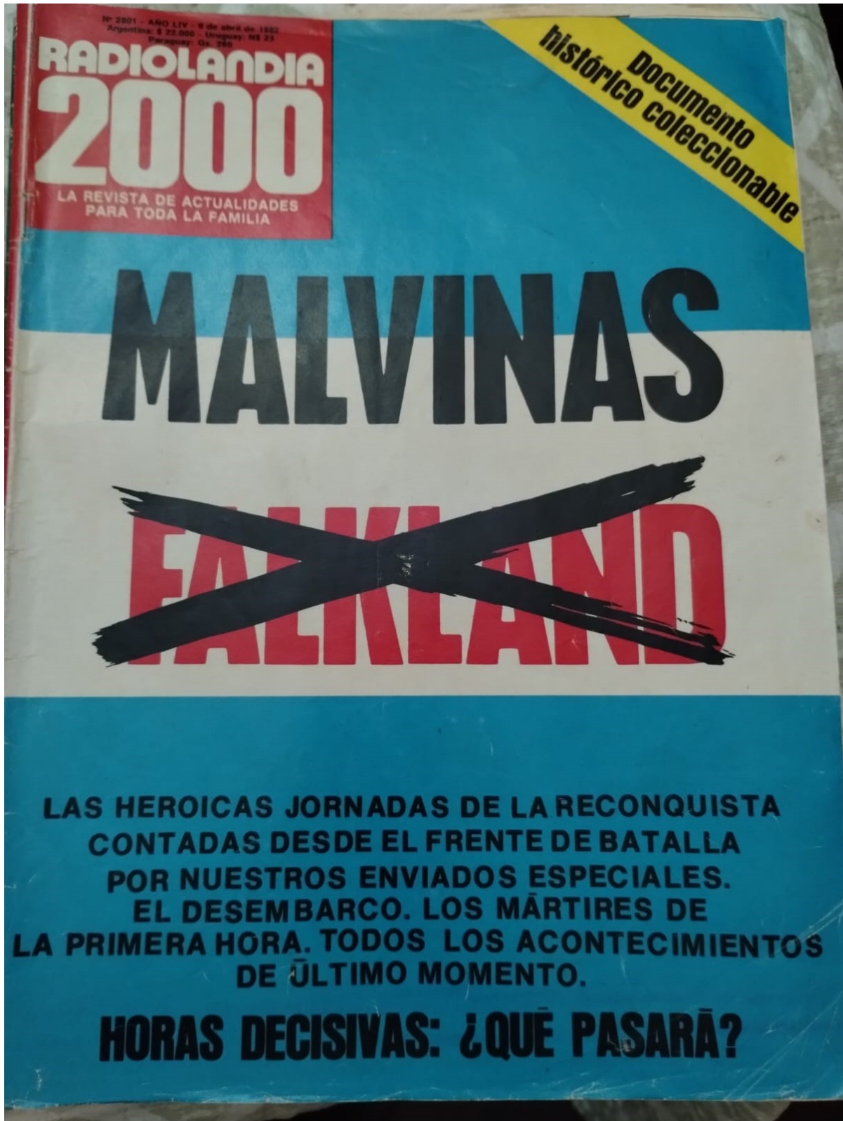
Figura 1. Tapa de Radiolandia 2000 (9 de abril de 1982).