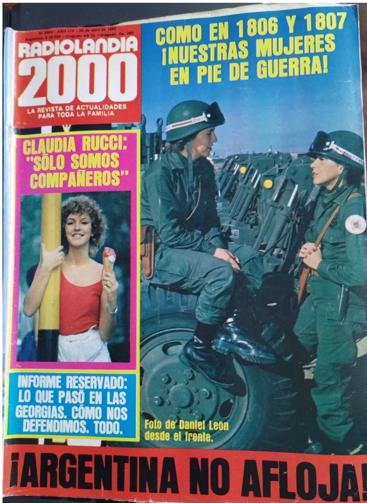
Figura 2. Tapa de Radiolandia 2000 (30 de abril de 1982).