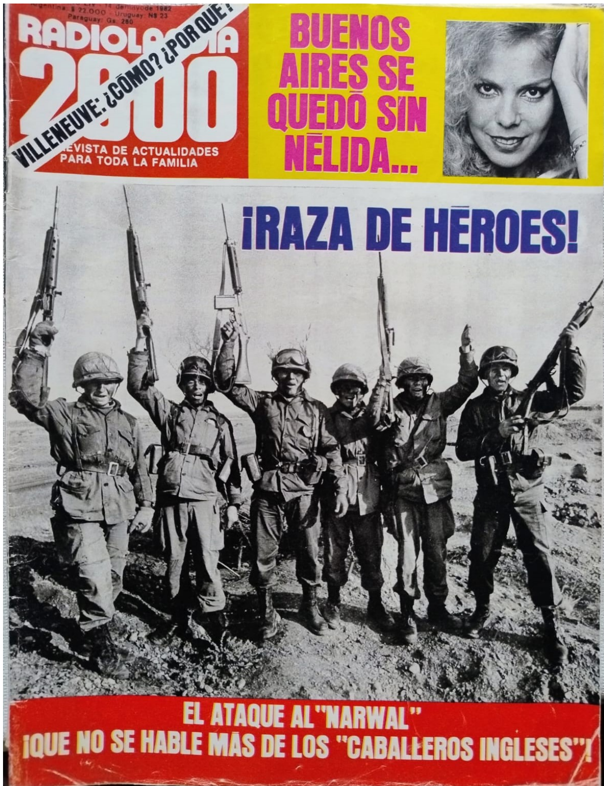
Figura 3. Tapa de Radiolandia 2000 (14 de mayo de 1982).