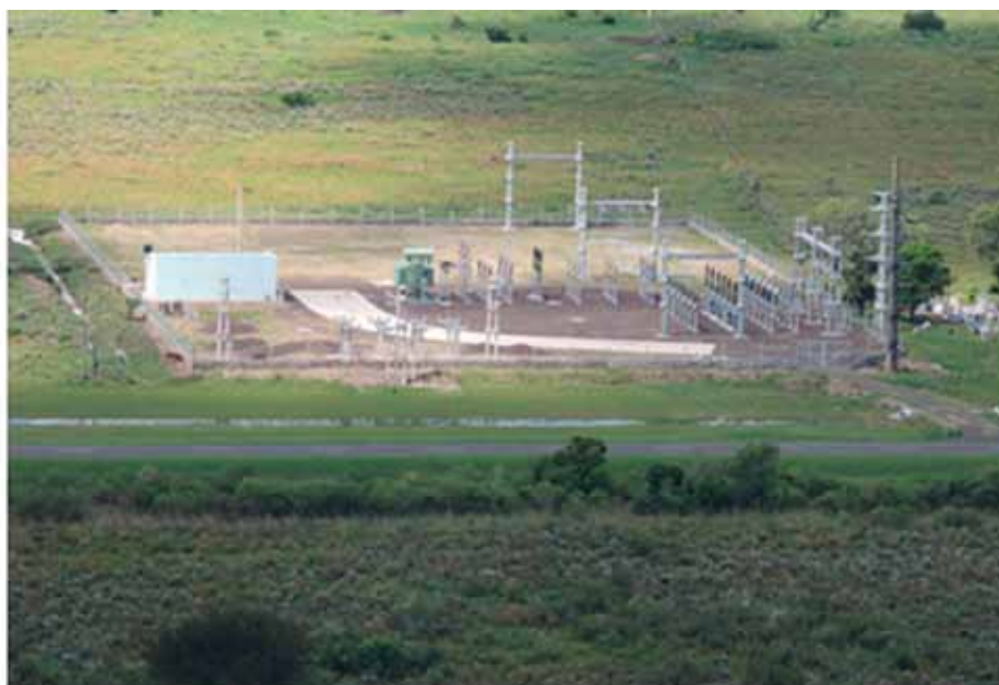
Figura N°3 Inicio de Traza. Vista aérea de la Estación Transformadora de Colonia Brugne, Empedrado provincia de Corrientes. 250 metros de altura, lado oeste sobre Ruta N°12 (Vuelo Oficial 27/02/14).