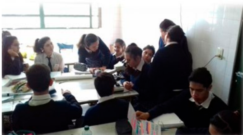
Figura1: alumnos participando en el T.P. de laboratorio Transporte a través de la membrana plasmática

prácticas de laboratorio a través de los registros de observación, b) Incentivar en los docentes de nivel medio la implementación de trabajos prácticos de laboratorio como un espacio para que los educandos aprendan hacer y se interesen por las ciencias naturales.