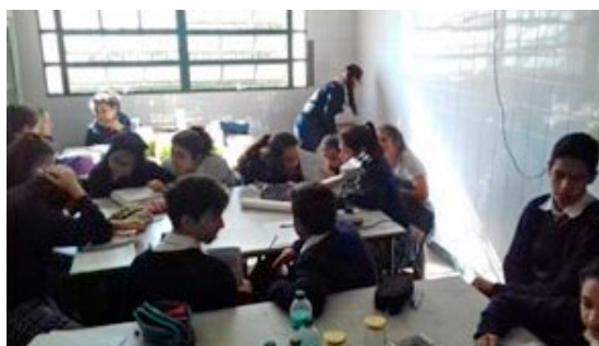
Figura 4: alumnos de 4to año participando del T. P. de laboratorio Sistema Reprodutor: Gónadas y células sexuales

Resultados: Los Residentes de la asignatura Didáctica de la Biología y Práctica de Residencia asumieron un rol protagónico en la ejecución del proyecto, lograron materializar y ser partícipes activos en la elaboración de las actividades y ulterior implementación. Asimismo, la incorporación