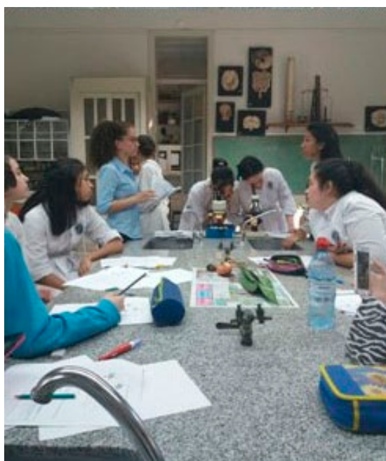
Figura 5: alumnos de 4to año participando del T. P. de laboratorio Reproducción Asexual

de los TP en el desarrollo de la mayor parte de los ejes estructurantes de la asignatura, fomentó y entusiasmó a los docentes de nivel medio a incorporarlo a su práctica sin limitaciones, ni condiciones, por el alcance y los resultados obtenidos. Reflejándose estos cambios en las producciones, evaluaciones y otras actividades de integración que los estudiantes de nivel medio efectúan.