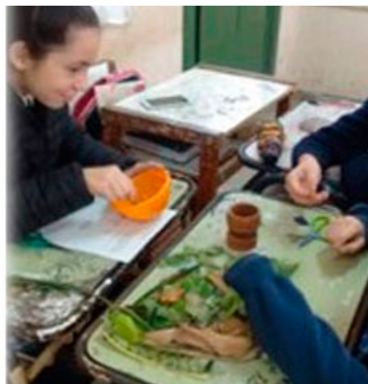
Figura 7: alumnos de 2do año participando en el T. P. de laboratorio Separación y extracción de Pigmentos vegetales

Se concretaron un total de 16 propuestas de TP de Laboratorio.