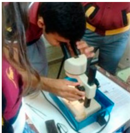
Figura 6: alumnos de 6to año reconociendo a través de la lupa las características morfológicas del vector que transporta el parásito del Mal de Chagas