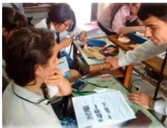
Figura 3: alumnos de 6to año participando en el trabajo Mal de Chagas: el vector

nos e ir trabajando sobre estos y efectuar los ajustes y cambios necesarios en el proceso de enseñanza y aprendizaje.