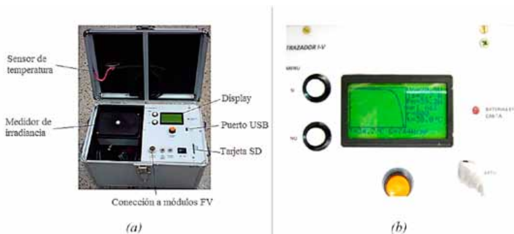
Figura 1: (a) Equipo trazador de curvas I-V híbrido, componentes principales. (b) Panel del instrumento.

El equipo desarrollado (Figura 1a) consta de un gabinete principal, diseñado en forma de maletín metálico, conveniente para su traslado y protección. Se aprecia en el instrumento su característica portable ya que está diseñado para ser trasladado hasta donde se encuentran las instalaciones FV autónomas, estas muchas veces, ubicadas en lugares de difícil acceso de nuestra región.