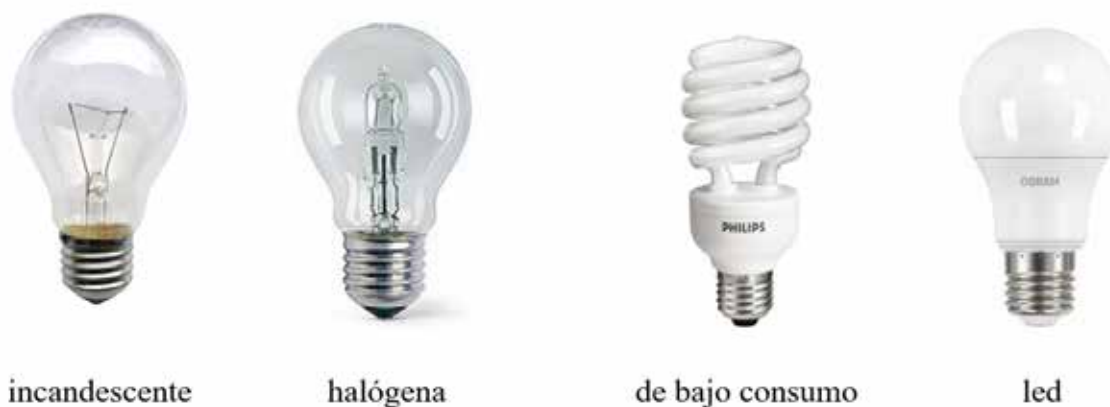
Figura 1. Distintos tipos de lámparas.

En este análisis resumiremos los principales resultados obtenidos hasta el presente y los estudios en marcha sobre la contaminación lumínica y los efectos sobre el ambiente, las plantas y animales, y el hombre. Haremos especial incapié en la tecnología Led, por su reciente y rápida difusión como sistema adoptado por todas las ciudades y promocionado desde los organismos estatales.