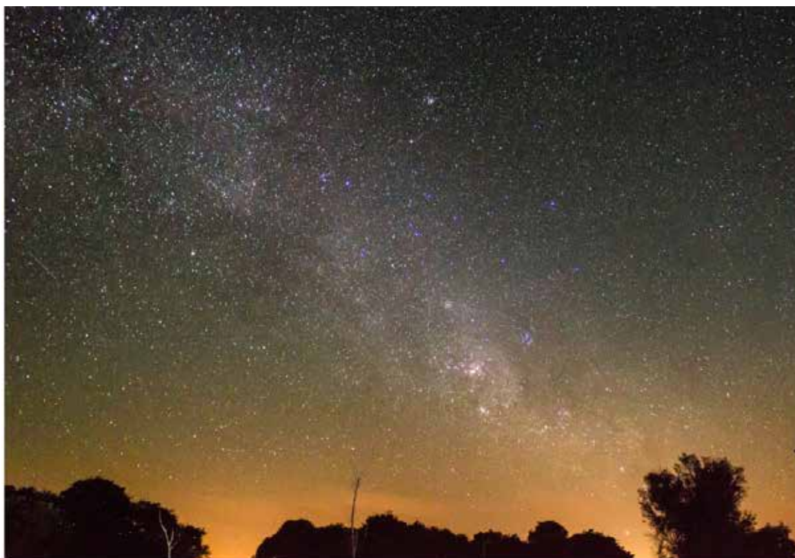
Figura 3. Cielo nocturno sin contaminación lumínica. Tartagal, norte de Santa Fe.

para permitir una visión perfecta. La International Dark Sky Association (IDA) tiene como objetivo proteger los cielos oscuros, y llevar adelante acciones de mitigación de la contaminación lumínica. Esta contaminación lumínica no sólo impide la investigación, sino también la recreación de la gente que disfruta de contemplar el cielo nocturno (“ el derecho a mirar las estrellas ”).