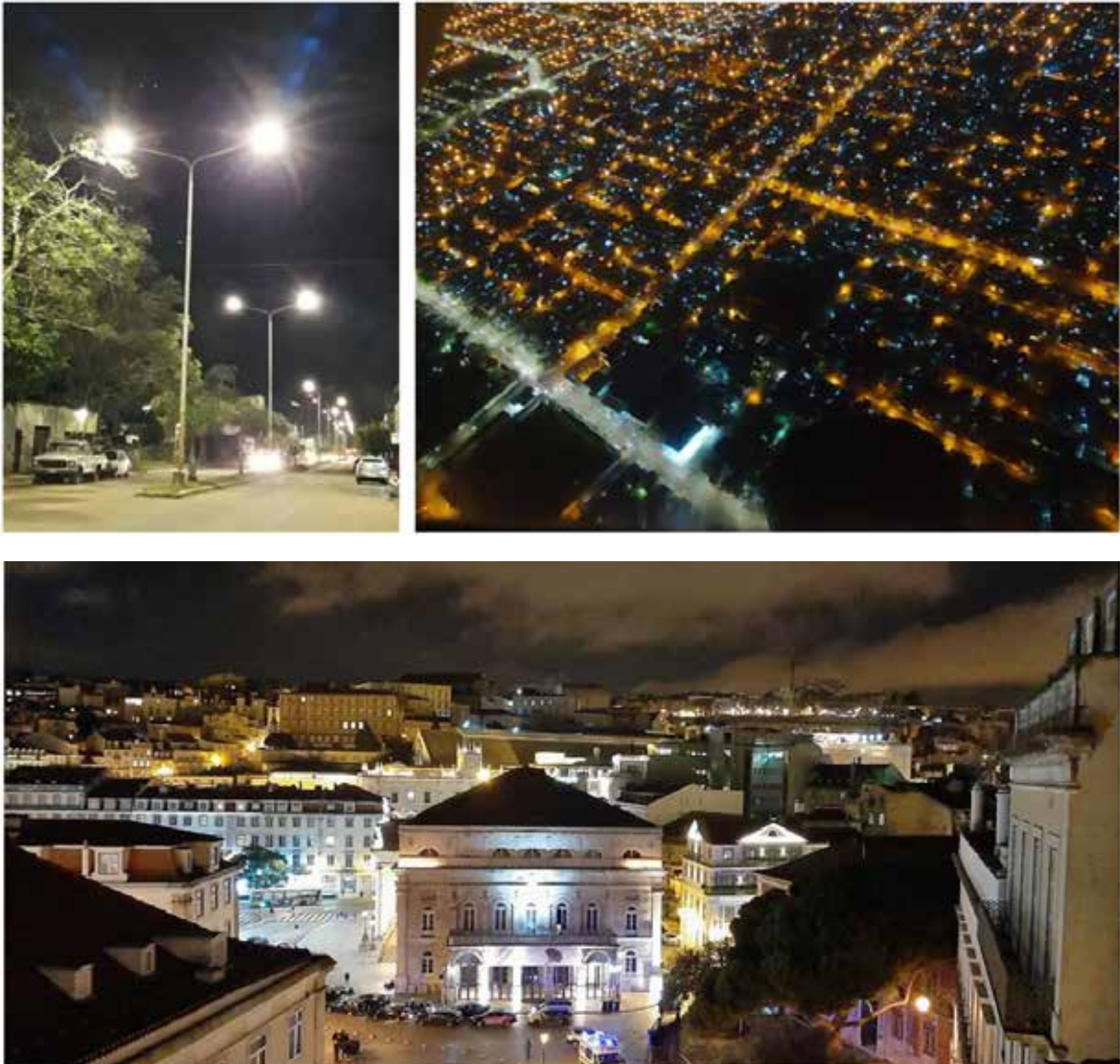
Figura 2. Contaminación lumínica. Arriba, calle iluminada con luminarias Leds, y vista aérea nocturna, ambas de la ciudad de Corrientes. Abajo, la ciudad de Lisboa con iluminación ornamental de edificios; obsérvese el resplandor de la luz en las nubes.

En horticultura. La iluminación Led en horticultura representó una revolución productiva (Alvarez, 2019), dada la capacidad de controlar el espectro, intensidad y dirección, junto a la enorme economía energética. Los ajustes del espectro permiten una eficiencia puntual en la planta, lo que redundará en una mayor producción y una mejora del valor nutricional de las plantas, y una mayor efectividad de la luz. La utilización específica de radiaciones del rojo y azul para los invernaderos con iluminación led es la responsable de la tonalidad púrpura de la luz observada en los sistemas de cultivo. Permite el manejo del ritmo de crecimiento modificando la