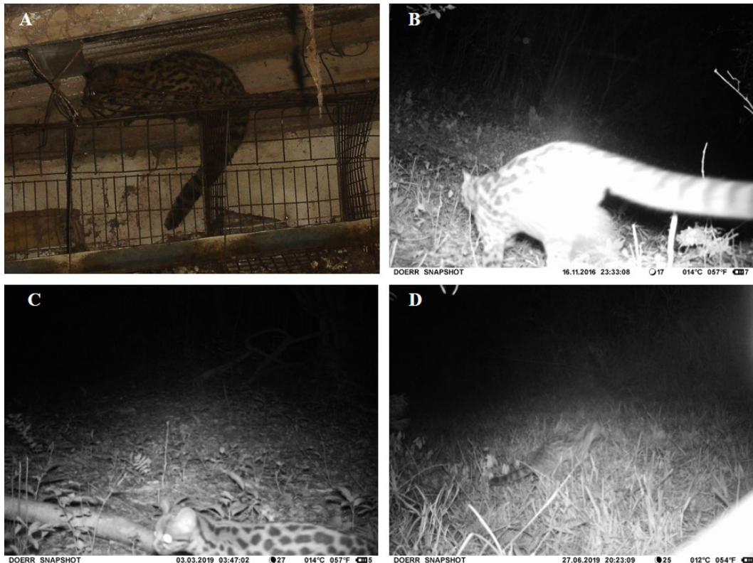
Figura 2. Algunos de los registros fotográficos de L. wiedii en Las Marías, Corrientes. A. El primer margay registrado, encontrado en un gallinero. Nótese la cola larga y gruesa, y las manchas características de la especie. B. El cuarto registro corresponde a este individuo, fotografiado a su paso junto a la cámara. C. El sexto individuo, fotografiado en un rodal de bosque nativo. D. El último margay fotografiado, mientras cazaba en la hierba de un camino interior de una plantación de pinos. (Fotos: A. José L. Anchetti; B, C, D, Mario Chatellenaz).

otros gatos del género Leopardus (Fig. 2 A, B, D). La única especie presente en el área que se asemeja a L. wiedii es el ocelote L. pardalis , pero es más pesado (11-16 kg vs. 2,3-4,9 kg), tiene mayor longitud corporal (70-100 cm vs. 53-79 cm), y su cola no es tan larga ni gruesa en relación con su cuerpo (Murray y Gardner, 1997; Oliveira, 1998; Pereira y Aprile, 2012).