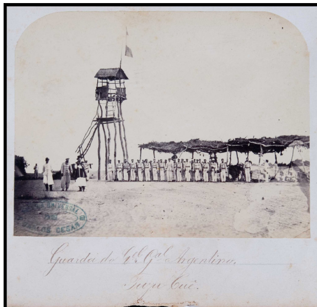
Fig. 25. Carlos César. Galería Universal “Guarda do Q. el G. al Argentino/ Tuyu Cué.”. Esta imagen fotográfica dio origen a varias representaciones y también, lugar a tergiversaciones respecto de su identidad. 1868. Albúmina, formato portrait cabinet. Museo Histórico Nacional, Río de Janeiro.

de Buenos Aires, reproducida por el especialista argentino Miguel Ángel Cuarterolo, estableciendo que fue realizada por un fotógrafo no identificado, con el título de “El mangrullo de José Giribone”, midiendo la albúmina, 10 X 15 cm. y datando de 1868 (Cuarterolo, 2000: 85).