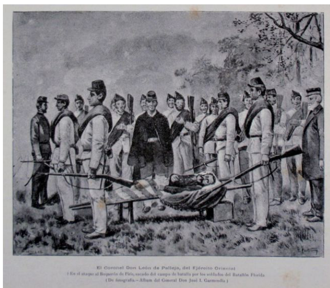
Fig. 17. Francisco Fortuny (1865 Tarragona, España – 1948 Buenos Aires, Argentina). El Coronel Don León de Palleja, del Ejército Oriental. La ilustración está basada en la fotografía de Javier López donde el artista español hizo gala de su destreza con la acuarela, técnica que dominaba recreando numerosas escenas de la guerra, publicadas en los fascículos del Álbum de la Guerra del Paraguay. La publicación coleccionable argentina fue fundada por José Clementino Soto, oficial de artillería y veterano de guerra, cuyo principal ilustrador era el referido Francisco Fortuny. 1893. Acuarela. Álbum de la Guerra del Paraguay. Año I, Entrega N° 16, 15 de setiembre de 1893.