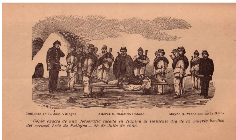
Fig. 16. Anónimo. Erróneamente se afirma que la fotografía en que se basó el artista anónimo, fue tomada en Itapirú. En realidad, solo días después, los restos embalsamados de Palleja viajaban al puerto de Itapirú para embarcarse a Montevideo donde recibiría sepultura. El grabado nos permite conocer la identidad de los tres oficiales que aparecen en la fotografía original que lo inspiró acompañando el cadáver del militar. 18 de julio de 1866. Litografía publicada en el fascículo “Gobierno Provisorio del Brigadier General Venancio Flores – Guerra del Paraguay”, Tomo II, Entrega 3, por Antonio H. Conte, Montevideo, Imprenta Latina, 1898, 32.

Del Pino. Relaciones entre fotografía y demás iconografía de la Guerra del Paraguay