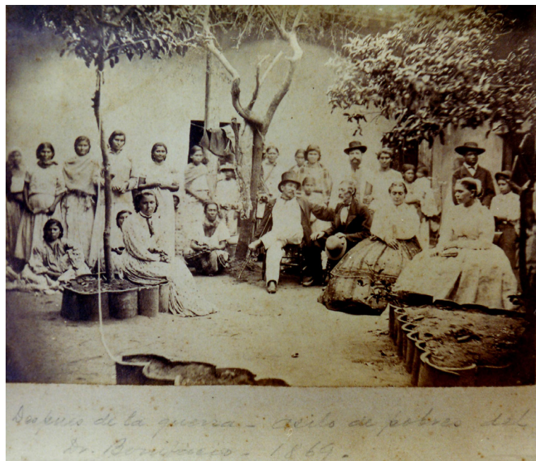
Fig. 30 Anónimo “ Después de la guerra – Asilo de pobres del Dr. Bonifacio – 1869 ” Albúmina, formato portrait cabinet.

A continuación presentamos unas fotografías constituidas en gráfico ejemplo que nos habla de la referida dispersión: