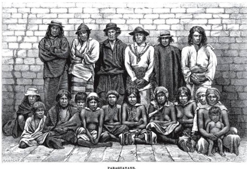
Fig. 20. E. Knights S.C., "Paraguayans". La litografía solo lleva el expresivo título de "Paraguayans" y está basado en la fotografía que veremos a continuación. Las dificultades técnicas de la época hicieron posible la reproducción a través de la técnica litográfica de muchas de estas imágenes fotográficas, tanto en libros como en la prensa periódica de la época. 1870. Grabado. Richard Burton "Letters from the Battle-fields of Paraguay", Londres, Tinslby Brothers, 1870.