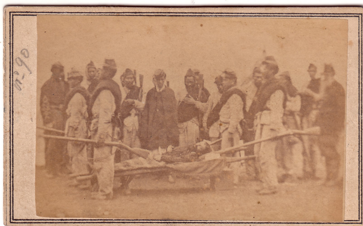
Fig. 14. Javier López, Bate y Cía. Conducción de los restos del coronel Palleja, 18 de julio de 1866, Albúmina, formato carte de visite. Museo Histórico Nacional, Montevideo.

Posteriormente, la firma Bate, también comercializó en Montevideo, esta misma imagen, en formato carte de visite. En enero de 1866, Bate anunciaba a sus clientes, su cierre definitivo, rematando las instalaciones y los negativos en febrero de ese mismo año.