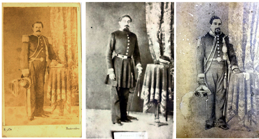
Fig. 10. Renoleau y Cía. Coronel Wenceslao Robles. Se trata de una reproducción del retrato original realizado en un anónimo estudio asunceno. ca. 1864. Albúmina, carte de visite, Museo Histórico Nacional, Montevideo, Uruguay. Fig. 11 Anónimo. Teniente 1º José E. Díaz, Jefe de Policía de Asunción, ca. 1865. Albúmina, carte de visite, Museo del Ministerio de Defensa Nacional, Asunción, Paraguay. Fig. 12 Anónimo. Teniente Coronel Hermógenes Cabral, instructor en Humaitá. Ca. 1864. Albúmina, carte de visite, Biblioteca Nacional, Asunción, Col. Juan E. O’Leary.

En nuestras pesquisas, pudimos encontrar asimismo, diseminadas en distintos repositorios públicos y privados paraguayos y uruguayos, diversas fotografías formato carte de visite pertenecientes a variados oficiales paraguayos, posando en un desconocido estudio de Asunción, ya que no aparece al dorso del passpartout de cada una de ellas, indicación alguna de la casa fotográfica donde fueron tomadas.