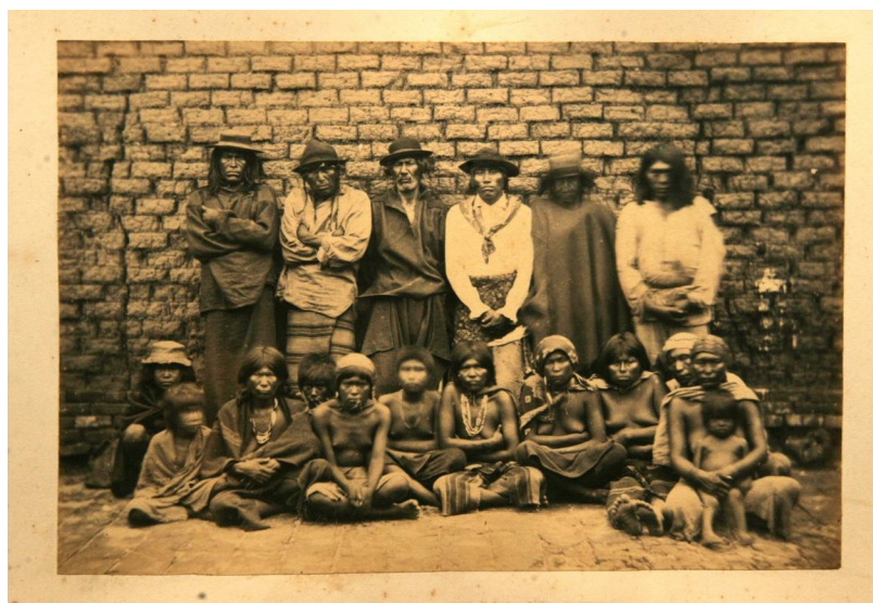
Fig. 21. Anónimo. Indios del Chaco. Esta fotografía también ha sido publicada en el libro de Ricardo Salles "Guerra do Paraguai: escravidão e cidadania na formação do exército", perteneciente al acervo de la Biblioteca Nacional de Río de Janeiro. Se conservan varias fotografías distintas de estos mismos indígenas lo cual nos habla de la dispersión de una serie original ahora dislocada en múltiples repositorios. Ca. 1869. Albúmina, formato portrait cabinet. Museo Histórico Nacional, Montevideo, Uruguay.