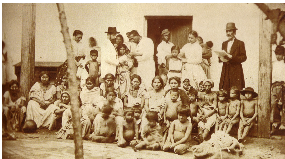
Fig. 31. Fotografía reproducida en el libro de Salles (Guerra do Paraguai, Memórias e Imagens, 165) cuyo original se custodia en el Archivo Nacional, Rio de Janeiro.