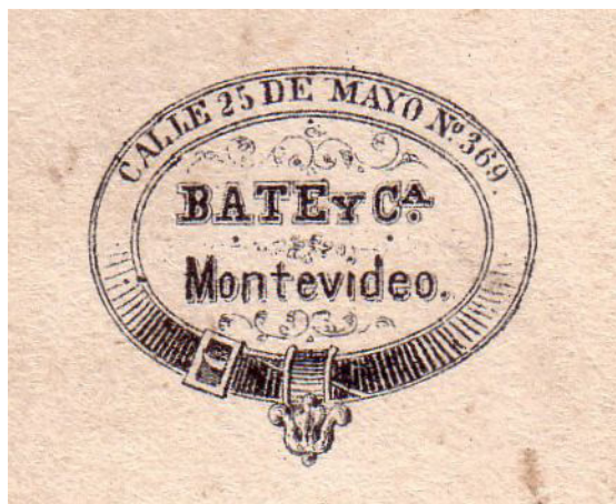
Fig. 5. Local de la firma Bate y Cía en Montevideo, Calle 25 de Mayo Nº 369, casi Bartolomé Mitre, vereda sud. Se inauguró este estudio el 6 de julio de 1861. En mayo de 1866, la firma fotográfica Bate respondió al desafío y envió a su fotógrafo Javier López al Paraguay.

En la nota que elevó la mencionada firma con fecha 5 de mayo de 1866 al gobierno de Lorenzo Batlle, procuraba apoyo oficial logístico y financiero, esto último, para solventar los gastos que supondría el emprendimiento. Argumentaba el acicate que suponían las “repetidas insinuaciones de los corresponsales del ejército aliado y a las