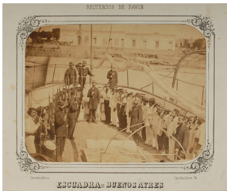
Fig. 2. Descalzo y Benza. Vista de la cubierta del vapor de guerra 25 de Mayo, Álbum de fotografías "Recuerdos de Pavón/Escuadra de Buenos Ayres", albúmina, 19 x 14,5 cm. Museo Mitre, gentileza Lic. Gabriela Mirande Lamédica.

Impuesta sólidamente la fotografía para cubrir conflictos bélicos, la Guerra de Secesión norteamericana (1861-1865) se constituyó en la conflagración más fotografiada del siglo XIX, donde se destaca especialmente la excepcional labor de Matthew Brady (1823-1896) y su equipo de operadores, quien generó durante la guerra civil alrededor de 8.000 negativos.