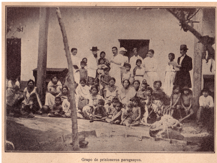
Grupo de prisioneros paraguayos.

Fig. 32. Anónimo “Grupo de prisioneros paraguayos.” Fotografía publicada en la edición en dos tomos de la clásica obra de Thompson, con una corta e inconsistente leyenda. (La Guerra del Paraguay, Tomo Segundo, Buenos Aires, Rosso & Cía, 1911: 92)