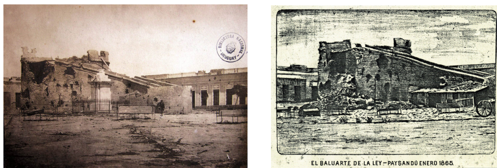
Fig. 3. Anónimo. La jefatura de Policía de Paysandú. Ubicada en la calle 8 de Octubre y Montevideo de la Ciudad de Paysandú, constituía el extremo sudoeste de la línea de trincheras. El edificio había sido recientemente construido, con ventanas enrejadas y altos muros pintados de cal. Fue uno de los bastiones más importantes de la defensa. Albúmina, enero 1865. Inv. ABN 264, Biblioteca Nacional, Materiales Especiales, Montevideo, Uruguay. Figura 4 “La Jefatura – Paysandú enero 1865.”. Litografía anónima publicada en la obra de Rafael Pons y Demetrio Errausquin “La Defensa de Paysandú” (Montevideo, 1887), y basada en la fotografía anterior.

de la escuadra porteña, luego coleccionadas en el álbum “Recuerdos de Pavón/Escuadra de Buenos Ayres”, con albúminas sobre cartón, formato “portrait-cabinet”.