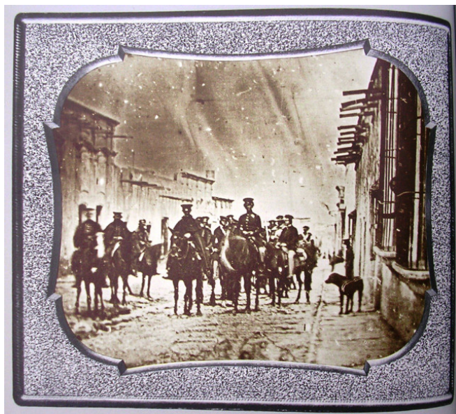
Fig. 1. General John Ellis Wool y su Estado Mayor, en la calle Real de Saltillo en 1847, durante la guerra entre México y Estados Unidos. Este daguerrotipo anónimo tendría el honor de ser considerado la primer imagen de carácter bélico registrada por una cámara. América pues, sería pionera en la saga del reportaje fotográfico de conflictos armados

Máquina del tiempo. Así define en una sola frase a la tecnología fotográfica el especialista español Bernardo Riego Amézaga (Riego, 1996: 163), resaltando desde su aparición a pocas décadas de iniciado el Siglo XIX, su enorme poder seductor y evocador para la sociedad contemporánea al hacer posible captar al mundo visible en una imagen registrada a través de una cámara. Temprano se incorporaría el novel adelanto tecnológico para obtener imágenes de contenido bélico, rivalizando con la labor que llevaban adelante desde muchos siglos atrás, artistas que dotados de las más diversas técnicas del arte, representaban episodios de enfrentamientos guerreros. Sobre este papel de la fotografía asociada a la guerra escribe Susan Sontag: “Desde que se inventaron las cámaras en 1839, la fotografía ha acompañado a la muerte. Puesto que la imagen producida con una cámara es, literalmente, el rastro de algo que se presenta ante la lente, las fotografías eran superiores a toda pintura en cuanto evocación de los queridos difuntos y del pasado desaparecido” (Sontag, 2003: 33).