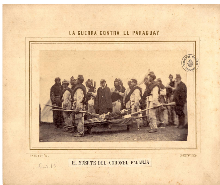
Fig. 13. Javier López, Bate y Cía. Muerte del Coronel Palleja. Esta imagen es la más conocida de la serie comercializada en Montevideo por el estudio fotográfico Bate y Cía. Fotografía N° 12, Primera serie, primera colección “La Guerra contra el Paraguay”, julio de 1866, albúmina 18cm. X 12cm., sobre passpartout de cartón con leyendas de 24 X 28 cm. Biblioteca Nacional, Sala de Materiales Especiales, Montevideo, Uruguay.

durar. Num contraste impactante, o corpo de Palleja, na solidão inescrutável da morte, foge à mise-en-scène. Uma bandeira do Uruguai sobre seus pés integra magistralmente todos os elementos da cena: a pose, a morte, a representação da realidade em um tempo homogêneo e vazio, e a arte do fotógrafo (Salles, 2003: 167).