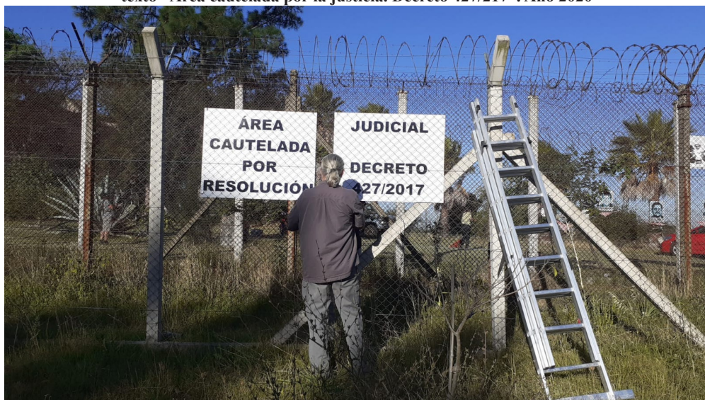
Figura 3. Jornada de colocación de carteles sobre el tercer vallado perimetral del edificio con el texto “Área cautelada por la justicia. Decreto 427/2017”. Año 2020