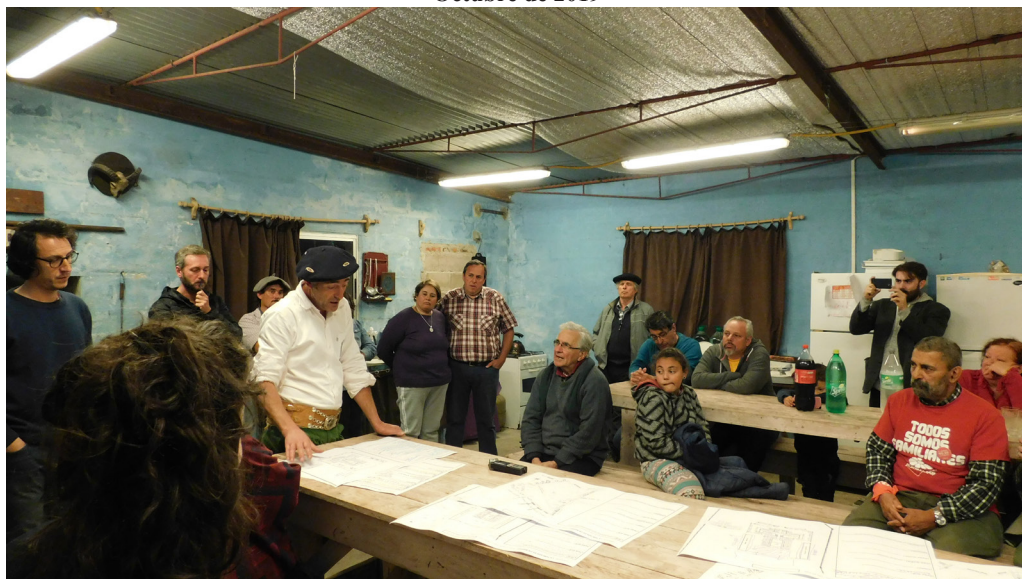
Figura 4. Mapeo colectivo sobre proyectos a futuro en el Sitio de Memoria, realizado en la sede de la Asociación Tradicionalista Troperos de La Tablada cuando aún no se había obtenido el comodato. Octubre de 2019