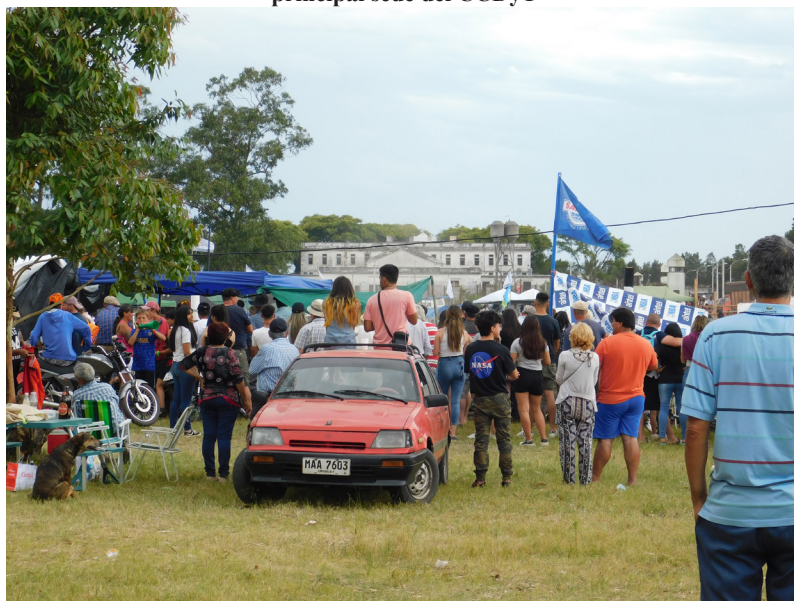
Figura 2. Jineteada organizada por la Asociación Tradicionalista Troperos de La Tablada en diciembre de 2021, realizada en el Ruedo de La Tablada. En primer plano podemos ver a los asistentes que observan las destrezas de los jinetes, y al fondo las traseras del antiguo edificio principal sede del CCDyT