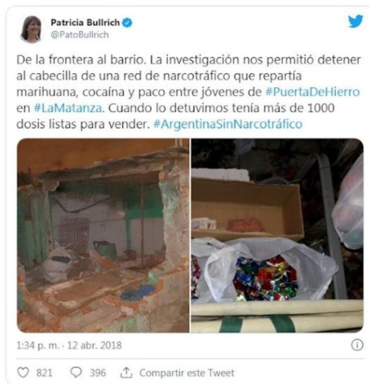
Figura 4. Tweet de la exministra de Seguridad, Patricia Bullrich

la exministra en el tweet de abajo -Figura 4-) e incautaron miles de dosis de drogas, especialmente cocaína, marihuana y pasta base.