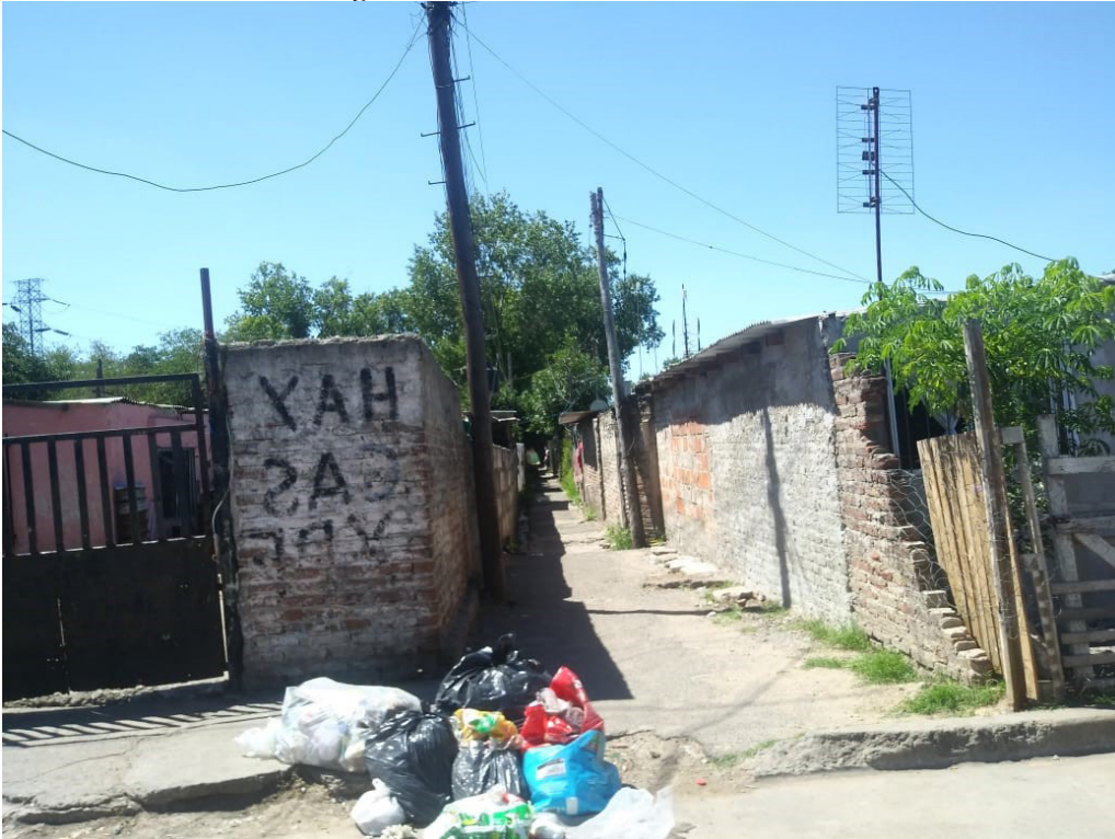
Figura 3. Pasillos de Puerta de Hierro

Fuente: Fotografía, María Florencia Girola, San Justo (La Matanza), 06/03/2021.