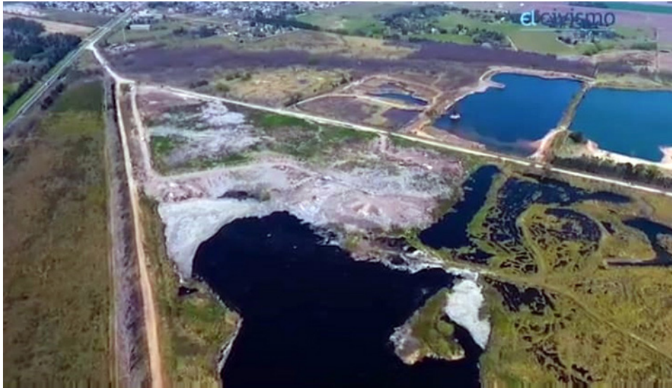
Figura 1. El basural a cielo abierto del Partido de Luján, Buenos Aires.

residuos alcanza los 16 metros de altura, aproximadamente, y en períodos críticos supera los 28 metros de elevación ( Municipio de Luján, 2020 ) [22]. El actual proyecto de saneamiento y reconversión del basural contempla el cierre del predio y la construcción de un centro ambiental en el predio de Sucre que incluye un relleno sanitario y una planta de tratamiento de RSU.