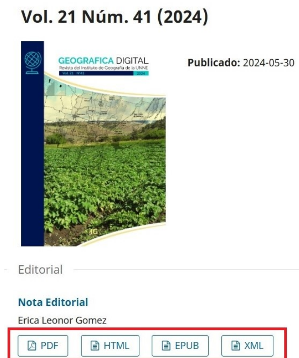
Figura 7. Geográfica Digital: formatos de publicación

Además, a partir del año 2021 y de la mano de Silvia Ferreyra, se incorporó el proceso de marcación utilizando la plataforma proporcionada por AmeliCA, lo que permitió optimizar la edición y difusión de los artículos de la revista, alineándola con estándares modernos de divulgación académica exigidos por algunas indexadoras. Este proceso permitió generar nuevos formatos de publicación, como ser XML y el presente año también se han incorporado HTML y EPUB (figura 7).