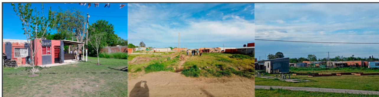
Figura 6. Tipologías de vivienda en Abasto Nuevo.

Las viviendas en el asentamiento Abasto Nuevo, suelen ser de construcción básica cuyas principales características tienen que ver con la autoconstrucción, es decir, las propias familias las han edificado progresivamente, a medida que han podido invertir en materiales. La tipología de vivienda puede ser variada, desde construcciones de ladrillo tradicional hasta casas de materiales más precarios, lo que refleja el proceso de consolidación del barrio (Figura 6).