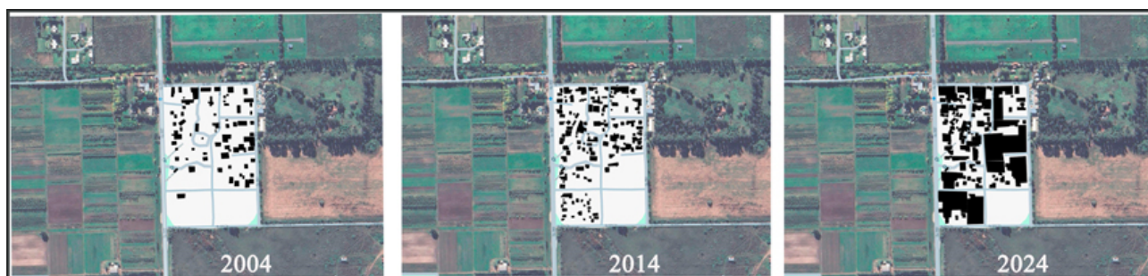
Figura 2. Evolución de la ocupación del barrio La Aceitera. Años 2004-2014 y 2024.

Las imágenes satelitales (Figura 2) ilustran de manera contundente el proceso de ocupación del suelo en el barrio La Aceitera, mostrando su evolución de un asentamiento incipiente y disperso en 2004 a una ocupación densa y consolidada en 2024.