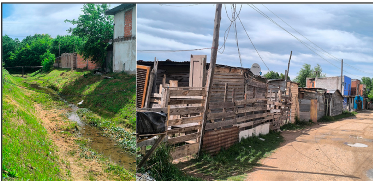
Figura 9. Infraestructura y servicios en El Rincón.

El barrio presenta graves deficiencias en términos de infraestructura: no cuenta con red de agua corriente, cloacas ni gas natural. El suministro eléctrico es irregular y, en algunos sectores, no existe alumbrado público. El transporte público es escaso y las calles de acceso se encuentran mayormente sin pavimentar, lo que aísla aún más al barrio, especialmente en días de lluvia (Figura 9).