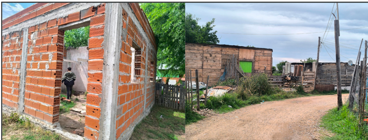
Figura 8. Tipologías de vivienda en El Rincón.