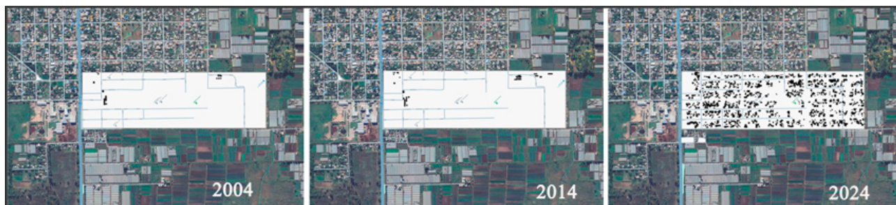
Figura 5. Evolución de la ocupación del barrio Abasto Nuevo. Años 2004-2014 y 2024.

La evolución de las formas de ocupación del suelo en el barrio Abasto Nuevo evidencia un proceso de urbanización informal caracterizado por la progresiva consolidación del tejido. En 2004 el área se encontraba prácticamente vacante, con un predominio de usos rurales y una ocupación inicial incipiente. Hacia 2014 se observa una expansión significativa de la mancha urbana, con la multiplicación de viviendas autoconstruidas y una ocupación más continua en torno a los ejes viales, aunque aún con vacíos internos. Finalmente, en 2024 el barrio presenta una ocupación casi total del suelo disponible, lo que denota un proceso de densificación hacia el interior de las parcelas y una consolidación residencial creciente. (Figura 5).