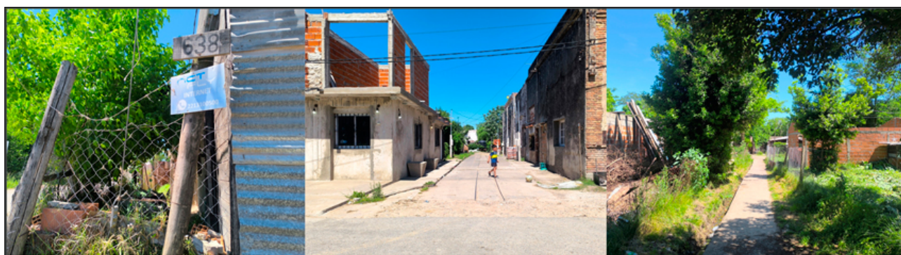
Figura 3. Tipologías de vivienda y materiales en La Aceitera.

En el barrio La Aceitera, las tipologías de vivienda predominantes reflejan el carácter de asentamiento informal. La mayoría de las edificaciones son precarias, de uno o dos niveles, y se caracterizan por ser autoconstruidas por los propios habitantes. Los materiales más utilizados son el ladrillo, la chapa y el cemento, lo que evidencia las limitaciones en recursos y la progresividad en la construcción (Figura 3). Esta tipología constructiva es un claro indicador de la infraestructura habitacional disponible en el barrio, mostrando la vulnerabilidad y la necesidad de políticas de mejoramiento de vivienda que prioricen materiales duraderos y la seguridad estructural.