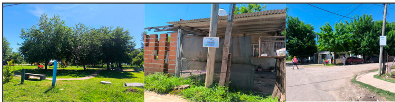
Figura 4. Infraestructura en La Aceitera, servicios y recreación.

El barrio padece una situación de precariedad en el acceso a servicios básicos, una característica definitoria de los asentamientos relevados por el ReNaBaP. Sus residentes enfrentan la falta de conexión formal a la red pública de agua corriente, la conexión irregular a la red de energía eléctrica, y el uso de pozos ciegos para el desagüe, lo que subraya la ausencia de una red cloacal formal. Además, el gas se obtiene a través de garrafas, evidenciando la carencia de una conexión a la red de gas natural. Esta situación en La Aceitera no solo destaca las deficiencias críticas en la infraestructura y los servicios disponibles en el barrio, sino que también subraya la urgente necesidad de políticas de integración socio-urbana que garanticen el acceso formal a estos servicios esenciales y mejoren las condiciones de vida de sus habitantes (Figura 4).