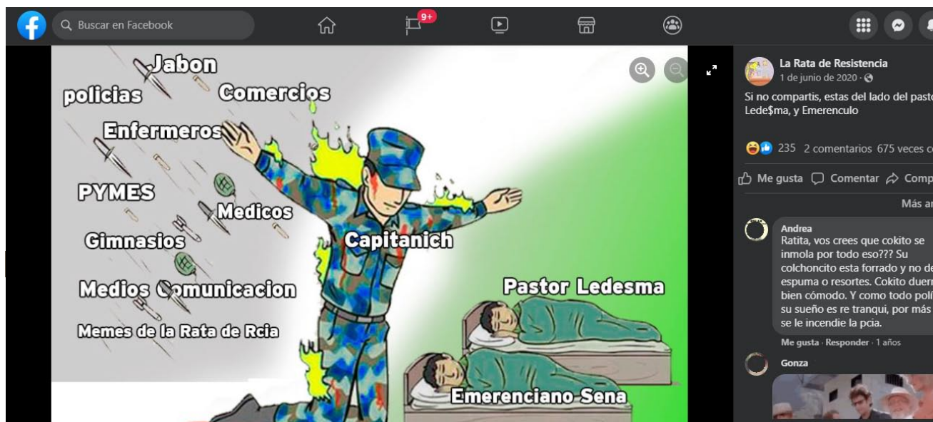
Imagen N.º 2

Luego de ganar la gobernación de Chaco en el 2019, en 2020, debido a la pandemia por covid-19 Jorge Milton Capitanich tuvo un rápido accionar con respecto a las restricciones en la circulación social, estas medidas adoptadas también por el gobierno nacional tuvieron un fuerte impacto económico en los comercios que estuvieron cerrados, sin embargo, durante la cuarentena el gobernador tomó decisiones que fueron polémicas para los ciudadanos y, como vemos, motivos de burlas y memes.