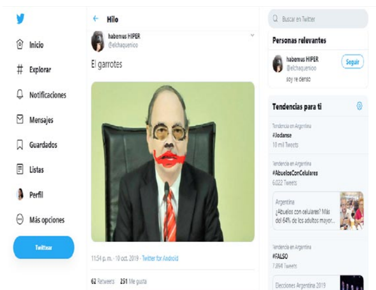
Imagen N.º 1