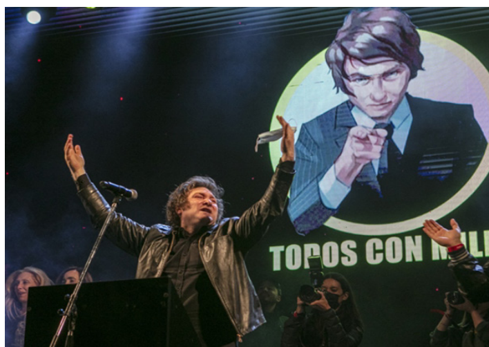
Imagen 5: Cierre de campaña en Movistar Arena, Buenos Aires, 18/10/2023.

En el cierre de aquella, en el Movistar Arena (18/10/2023), se privilegia en el escenario otra, en la que un círculo enmarca la imagen destacándola pero marcando, a la vez, que sale de ese cerco. La consigna en este caso es “Todos con Milei”, lo que atenúa cierto gesto amenazante ya que tiende a ampliar el número de los posibles votantes: