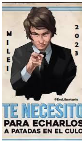
Imagen 4: Pegatina que circuló como campaña de La Libertad Avanza (elecciones de octubre 2023).

En el cierre de aquella, en el Movistar Arena (18/10/2023), se privilegia en el escenario otra, en la que un círculo enmarca la imagen destacándola pero marcando, a la vez, que sale de ese cerco. La consigna en este caso es “Todos con Milei”, lo que atenúa cierto gesto amenazante ya que tiende a ampliar el número de los posibles votantes: