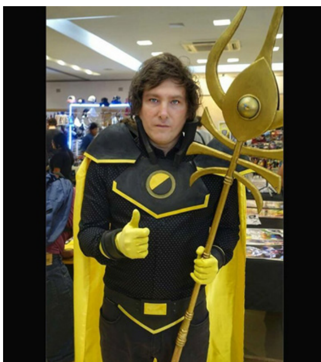
Imagen 2: Milei, J. (2019, febrero). Evento de cosplay organizado por Jigoku Producciones [Fotografía]

En la imagen siguiente se destaca la jerarquía del personaje, por sus atributos, y el vínculo, por el pulgar levantado, con la pose fotográfica “oficial”, la imagen-marca, y reiterada, en la que comparte la escena con personajes políticos o partidarios ocasionales que lo imitan o no (Arnoux, 2025c).