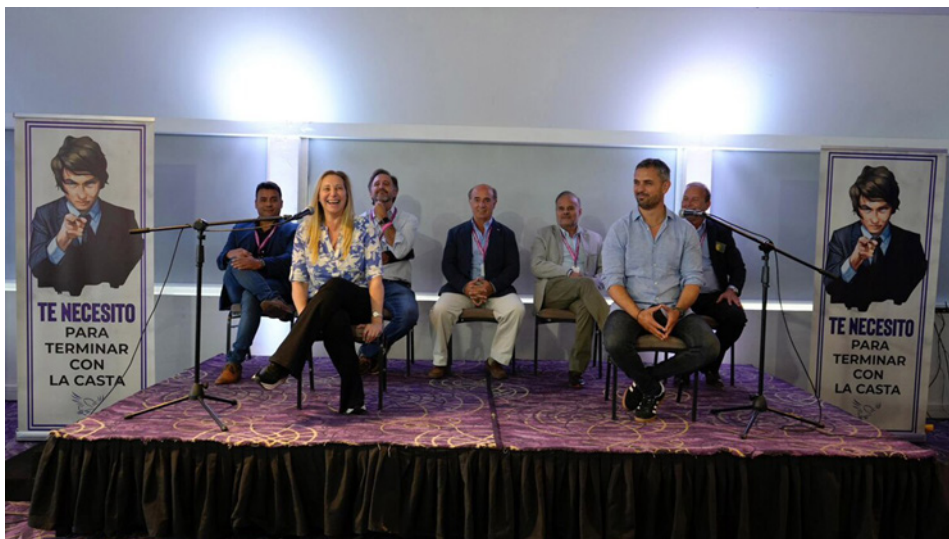
Imagen 6: Acto de afiliación en Tucumán, 26/10/2024.

En la frase, si bien se retoma el inicio del reclutamiento primero, se cambia el registro pero aparece identificado el objeto malo al cual se enfrenta (ese “los” de la pegatina): la casta. Esta designación por su misma vaguedad permite que se incluyan variados enemigos sobre los cuales se puede volcar el odio o el resentimiento de diferentes colectivos.